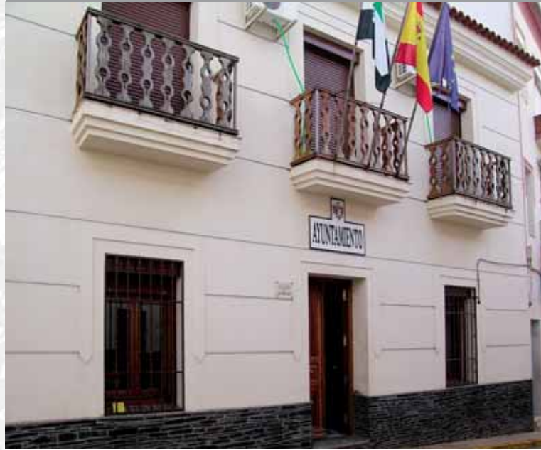
Fachada del Ayuntamiento.