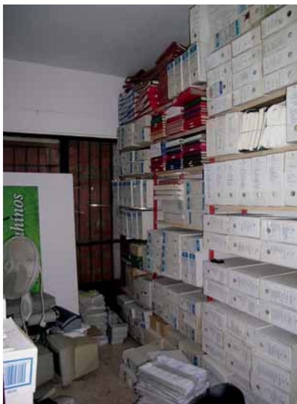
Archivo Municipal de Zahínos antes de la elaboración del Inventario.