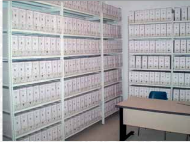
Archivo Municipal de Zahinos después de elaborar el inventario.