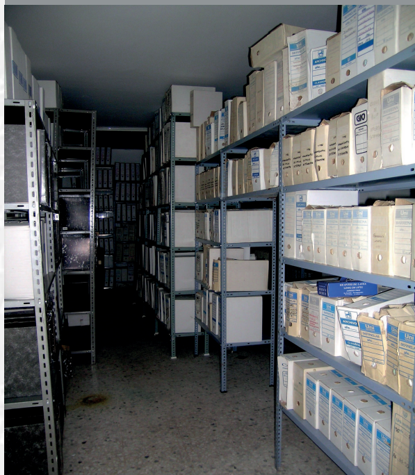
Archivo Municipal de Barcarrota antes de la elaboración del Inventario.