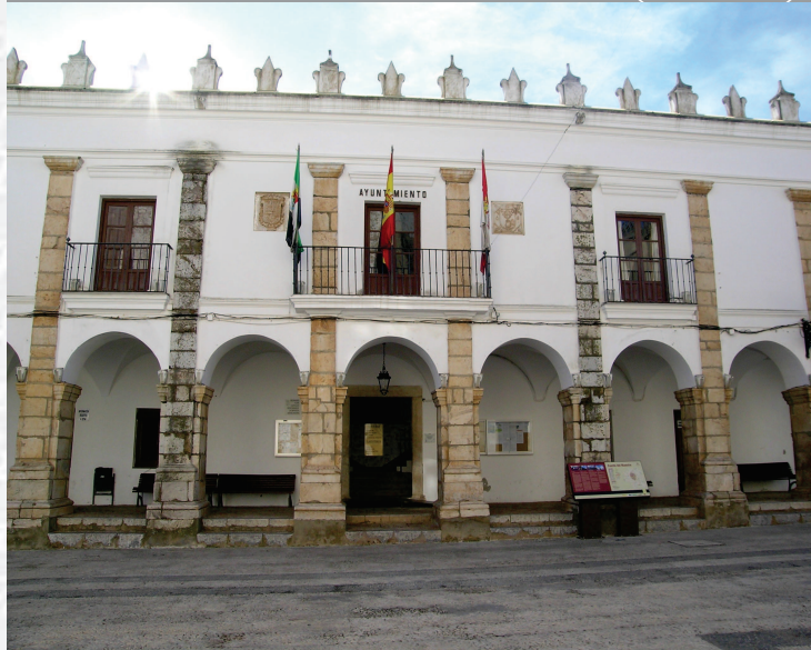
Ayuntamiento de Fuente del Maestre

STREMADURA Por Lopez año de 1700. y por Fuente, por el ucia, y por el Occidente con sien- incia del Reyno de Portugal. nte a sus 62. leguas, y Norte por lo mas ancho tertilidad esta Pro- Rios Tago, y Guadiana, viesan por en medio, y chicas, que son el demon- y el straitta & Badajoz la, Capital de la Provin- Obispado, y en Fuente, sobre dima, edificada por los llaza de guerra, y tiene Castillos, el uno del regal, y del otro lado erro esta el fuerte de S. Merida, llamada Angu- bro tiempo libez de la antigua situada sobre el Rio Guadiana.