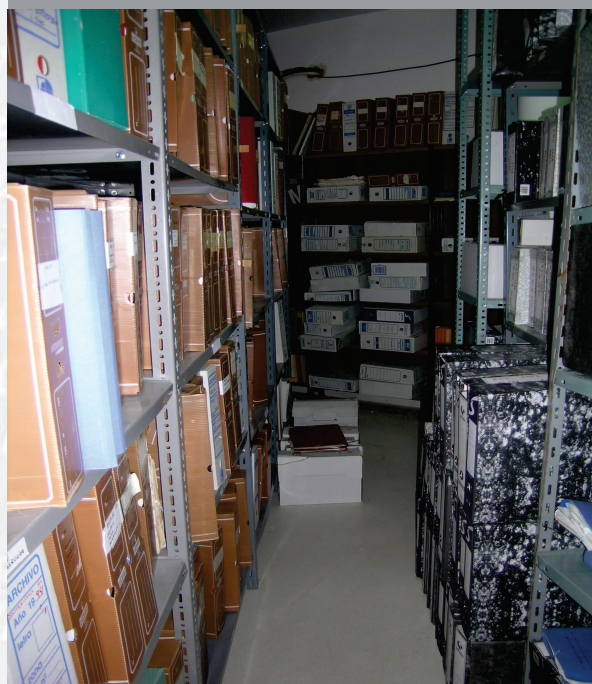
Archivo Municipal de Fuente del Maestre antes de la elaboración del Inventario.