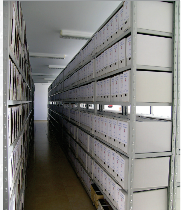
Archivo Municipal de Fuente del Maestre después de la elaboración del inventario.