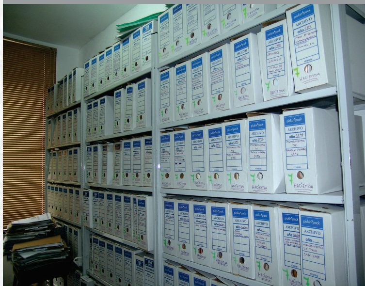
Archivo Municipal de La Lapa antes de la elaboración del Inventario.