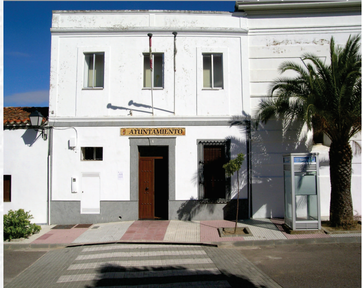
Ayuntamiento de La Lapa

STREMADURA Por Lopez año de 1700. y pa Fuera, por el ucia, y por el Occidente con alien- incia del Reyrio de Portugal. nte a sus 62. leguas, y Norte por lo mas ancho tertilidad esta Pro- Rios Tago, y Guadiana, viesan por en medio, y chicas, que son el dion- y el stradilla & Badajoz la, Capital de la Provin- Obispado, y un Puente sobre dima, edificado por los llaza de guerra, y tiene Castillos, el uno del regal, y del otro lado erro esta el fuerte de S. Merida, y en esta Angu- bro tiempo libeza de la antigua situada sobre el Rio Guadiana.