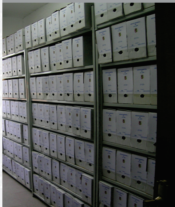
Archivo Municipal de La Lapa después de la elaboración del inventario.