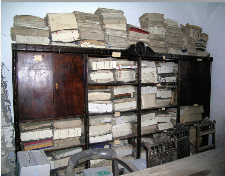
Archivo Municipal de Medina de las Torres antes de la elaboración del Inventario.