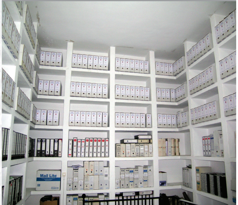
Archivo Municipal de Medina de las Torres después de la elaboración del inventario.