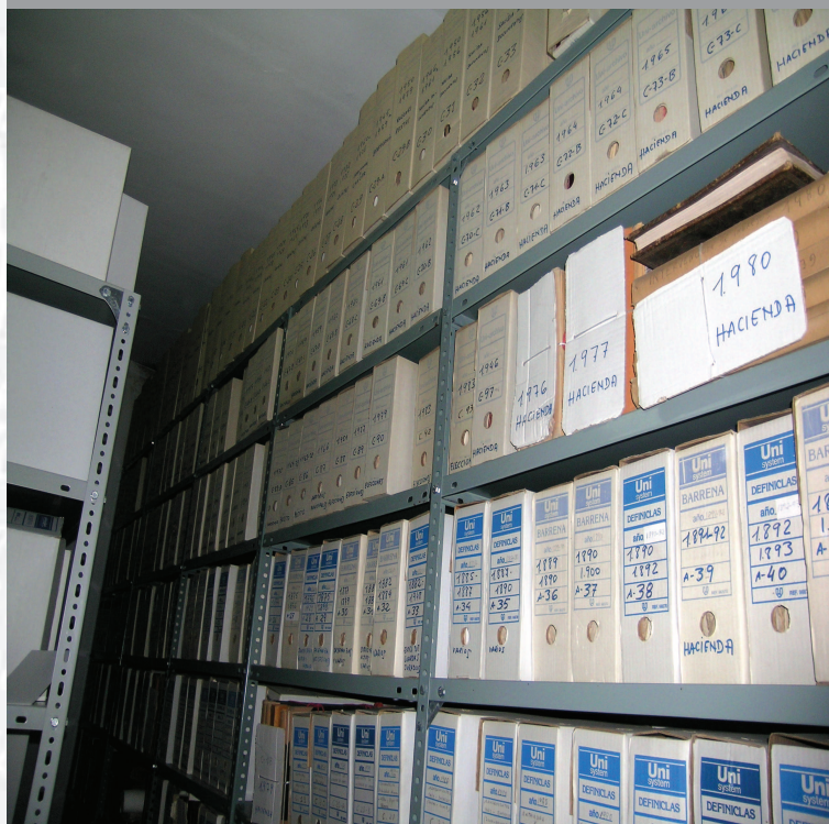
Archivo Municipal de Segura de León antes de la elaboración del inventario.