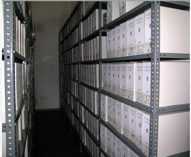
Archivo Municipal de Segura de León después de la elaboración del Inventario.