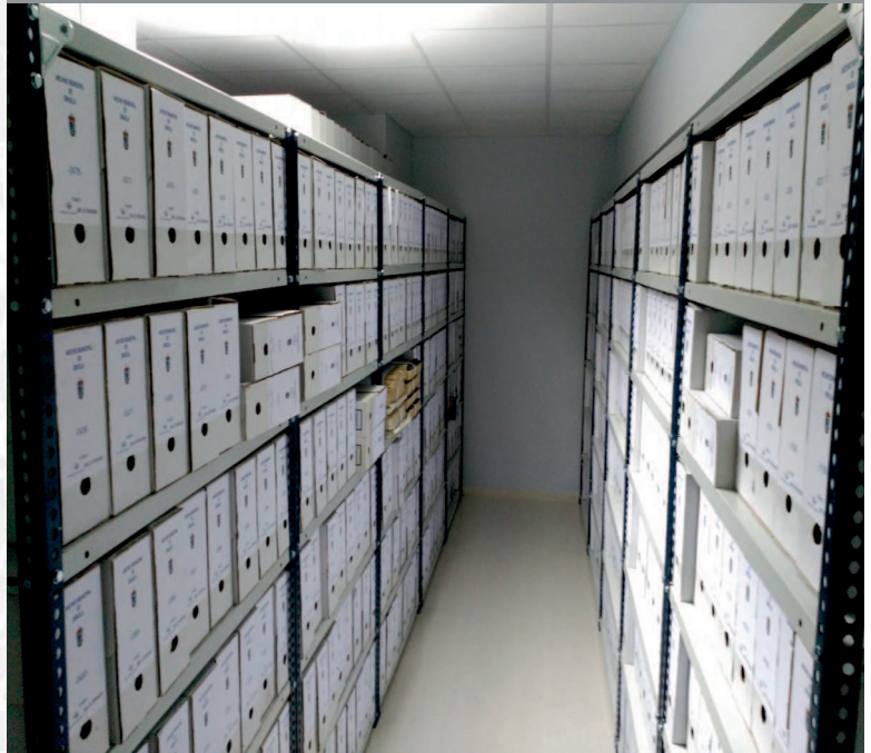
Archivo Municipal de Siruela después de la elaboración del inventario.