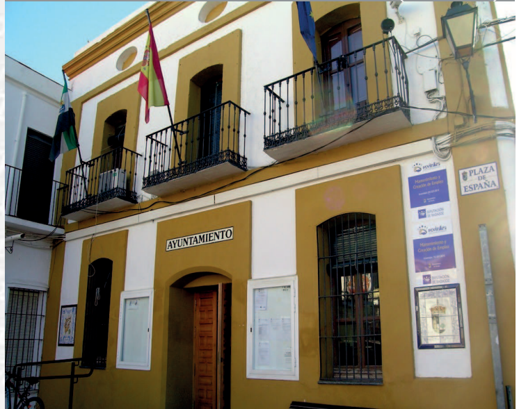
Ayuntamiento de Siruela

STREMADURA Por Lopez año de 1700. y pa Fuera, por el ucia, y por el Occidente con sien- incia del Reyno de Portugal. nte a sus 62. leguas, y Norte por lo mas ancho tertilidad esta Pro- Rios Tago, y Guadiana, viesan por enmedio, y chicas, que son el diomon- y el stradilla & Badajoz la, Capital de la Provin- Obispado, y un Puente sobre diano, edificado por los llaza de Guerra, y tiene Castillos, el uno del rejal, y del otro lado erro esta el fuerte de S. Merida, y en esta Angu- nto tiempo libre de la antigua situada sobre el Rio Guadiana.