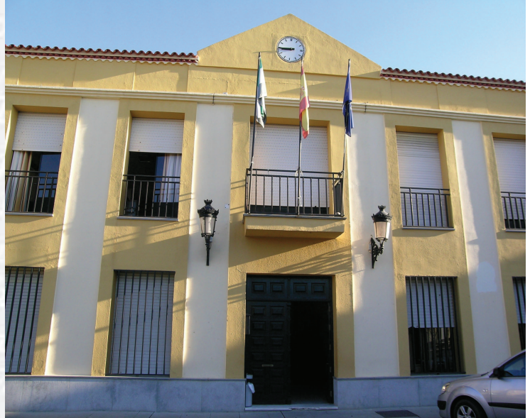
Ayuntamiento de Talavera la Real