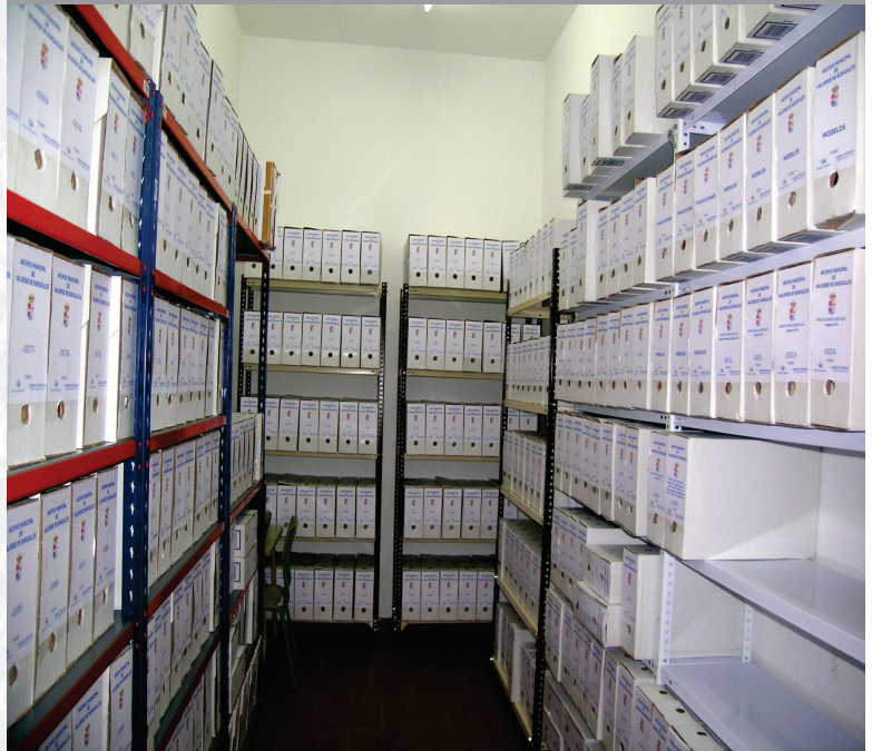
Archivo Municipal de Valverde de Burguillos después de la elaboración del inventario.