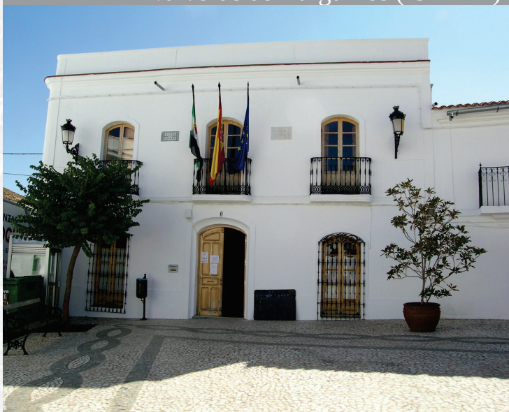
Ayuntamiento de Valverde de Burguillos

STREMADURA Por Lopez año de 1700. y pa Fuera, por el ucia, y por el Occidente con Alien- incia del Reyrio de Portugal. nte a dia, 62. leguas, y Norte por lo mas ancho tertilis en esta Pro- Rios Tago, y Guadiana, viesan por en medio, y chicas, que son el di non- y el stradilla & Badajoz la, Capital de la Provin- Obispado, y en Puente sobre dima, edificada por los llaza de guerra, y tiene Castillos, el uno del O chelPet regal, y del otro lado erro es la el fuerte de S. Merida, la merita Angu- bro tiempo libeza de la antigua situada sobre el Rio Guadiana.