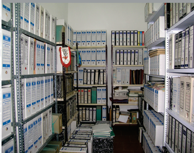
Archivo Municipal de Valverde de Burguillos antes de la elaboración del Inventario.