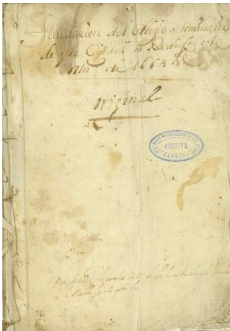
Libro 1º. Fundación Seminario de San Atón. Badajoz. 1664-167