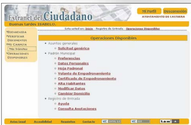
Página web: Extranet del Ciudadano