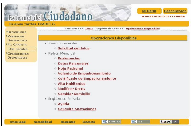
Página web: Extranet del Ciudadano