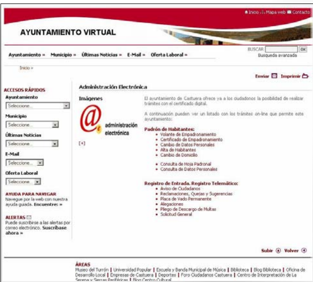
Página web: Ayuntamiento Virtual