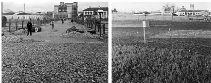
Dos fotos diferentes de la Avenida de Huelva, atribuidas a Pesini, de 1936. Al fondo y de izquierda a derecha, el cuartel de Ingenieros, Correos y Telégrafos y el colegio General Navarro.