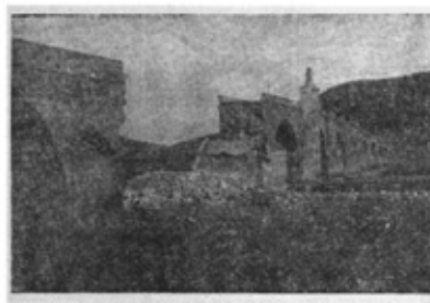
MEDIELLEN. El paso de la Sierra de Enfrente al almor de la batalla en la destrucción de puentes y puentes, en momentos como el puente de Medellín, visto por un soldado.