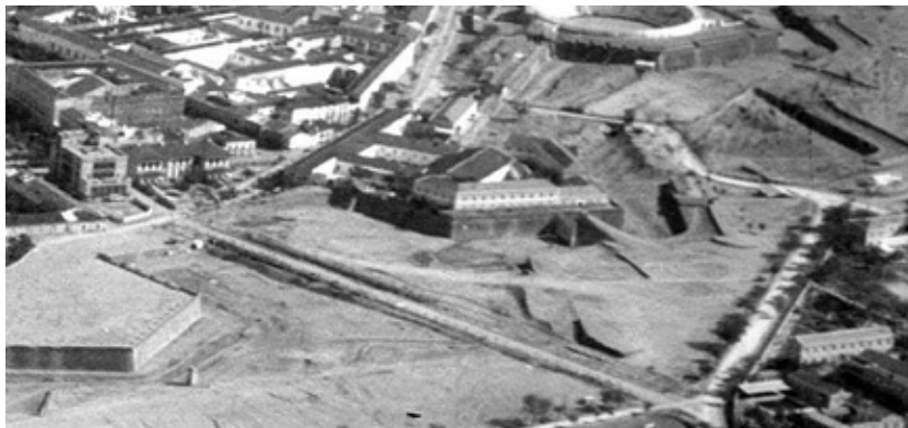
Fotografía detalle de los años treinta: los dos baluartes entre los que se trazó la Avenida de Huelva, que conducía al cuartel de Menacho; e intramuros el edificio de Correos y el colegio General Navarro, que aún existen. Saliendo de la imagen, centrado a la izquierda, el desaparecido Parque de Ingenieros.