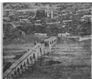
MEDIELLEN. Puente de nuestra provincia ocupado el domingo por nuestras tropas en su avance hacia La Serena. En la foto se advierte la voladura de dos arcos del magnífico puente sobre el Guadiana que realizaron los propios cuando se tomó la Sierra de Enfrente, desde la cual fue tomada esta foto.

de Pesini 10 , desplazado para cubrir la información del diario pacense, que fueron publicadas los días 10 y 18 de agosto.