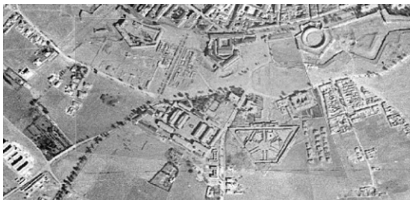
Imagen delimitada del Vuelo Americano Serie A 1945-1946, en que se pueden apreciar los dos baluartes de Santiago y San Juan, los cuarteles de La Bomba y Menacho –éste extramuros- y la cárcel; a la derecha del recuadro la Plaza de Toros recogida en el baluarte de San Roque. Entre los dos anteriores y hacia Menacho, la avenida de Huelva como una simple alameda, zona de trabajo de la Brigada una década antes.

El otro gran objeto de la información periodística (no firmada) está en las obras que han llevado a cabo. Y el primer cometido de la Brigada fue “el camino que hay desde la entrada de la Avenida de Huelva, frente al edificio de Correos y Telégrafos, hasta el cuartel de Menacho”: una rampa entre este acuartelamiento y el de La Bomba, la explanada sobre los glacis, derribo de murallones y terraplenes, actuaciones cercanas a Puerta Pilar, etc. Estamos en la fase inicial de urbanización de todo este espacio al sur de la ciudad, situado entre los enclaves defensivos de los baluartes de Santiago, San Juan y San Roque, más los cuarteles de Menacho y La Bomba. Éste último y el baluarte de San Juan, que lo acoge, son derribados finalmente en los años 60, y el acuartelamiento de Menacho a comienzos del siglo XXI.