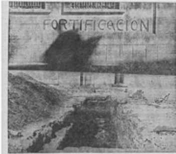
Una foto de un momento de fortificación que se desarrolla por las montañas de la Serena y que se está ejecutando de acuerdo de orden de nuestro jefe de línea para la construcción de un sistema de alambres puros acorazados para el campo de batalla de la Sierra.

POR LAS RUTAS DE LA SERENA De siete a nueve millones de pesetas robó uno solo de los saqueadores Un titulado capitán Iglesias llegó a pedir varias veces que le dieran de "tapas" orejas de fascistas (Crónica de nuestro enviado especial A. Reyes Huertas)