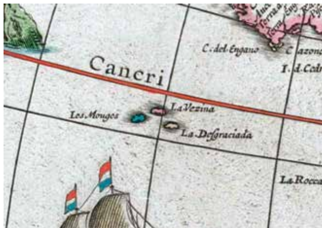
Detalle del Americae nova Tabula de Guilejelmo Blaeuw

Las pobres e ignorantes gentes que sufrían el azote de los caciques en su propia tierra y explotación de los terratenientes, eran pasto fácil de las seductoras promesas de los ganchos que sabían bien donde estaban los pueblos más subdesarrollados y con más necesidades, por lo que pronto inocentes familias completas que convencieron a su vez a otros familiares se aprestaron al viaje hacia el sur para embarcar. Vendían su casucha, muebles o algún pedazo de tierra y unos andando, otros en carros tirados por mulas y caballerías emprendían el éxodo hacia lo desconocido continuando siendo engañados por pícaros de todo pelaje y condición, al no saber leer ni escribir, para arreglarles la documentación que necesitaban para el viaje, incluso prometiéndoles que después podrían viajar los que se quedaran rezagados.