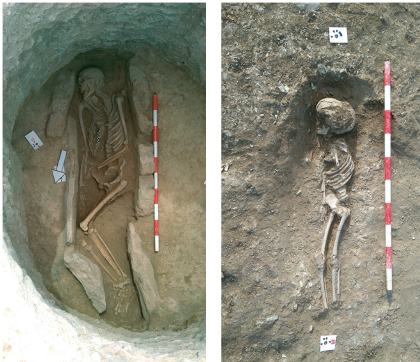
Fig. 6. Inhumaciones en hoyo de El Pantano II e inhumación infantil en fosa del Sector 2 de El Pantano I