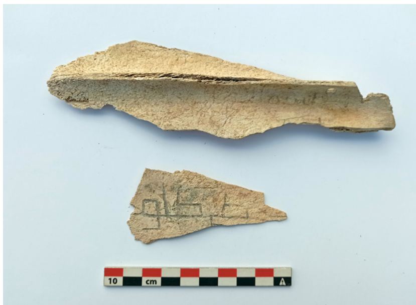
Fig. 15. Escápuas silo 12