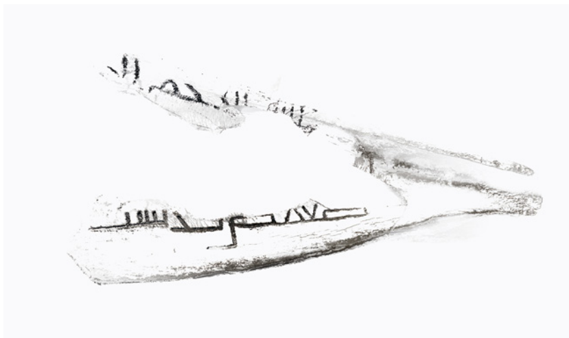
Fig. 13. Escápula reconstruida parcialmente a partir de varios fragmentos, conserva parte del renglón superior y primero, con la basmala completa, y prácticamente entero el renglón inferior, que es el tercero y último, del que solo se ha perdido la parte superior de algunos grafemas. En cuanto al segundo renglón central, ha desaparecido entero, salvo por el pequeño fragmento superior de un grafema.