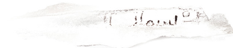
Fig. 16. Escápula silo 12. Fragmento 1.

Conserva el inicio de la basmala completa.