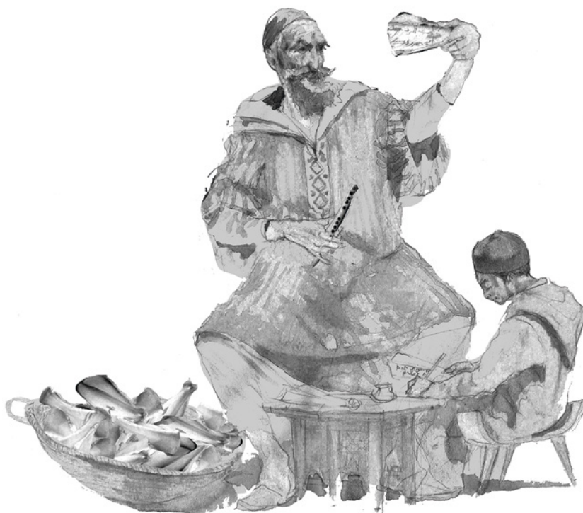
Fig. 7. Recreación de uso de las escápulas epigráficas medievales islámicas. Ramón Llamas, 2022

no llegaran a ser utilizadas. Pero también se plantea la duda de la existencia de escápulas que no conserven huella de su uso; por ejemplo, si fueron pintadas, pero no grabadas, tal y como presumiblemente sucedía en la cara externa de las que conservan los epígrafes grabados en la otra cara.