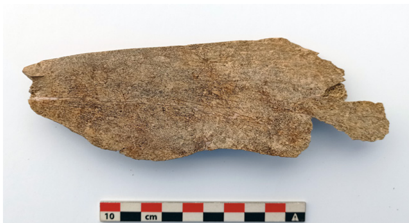
Figs. 11 y 12. Escápula Silo 29. Sector 2.