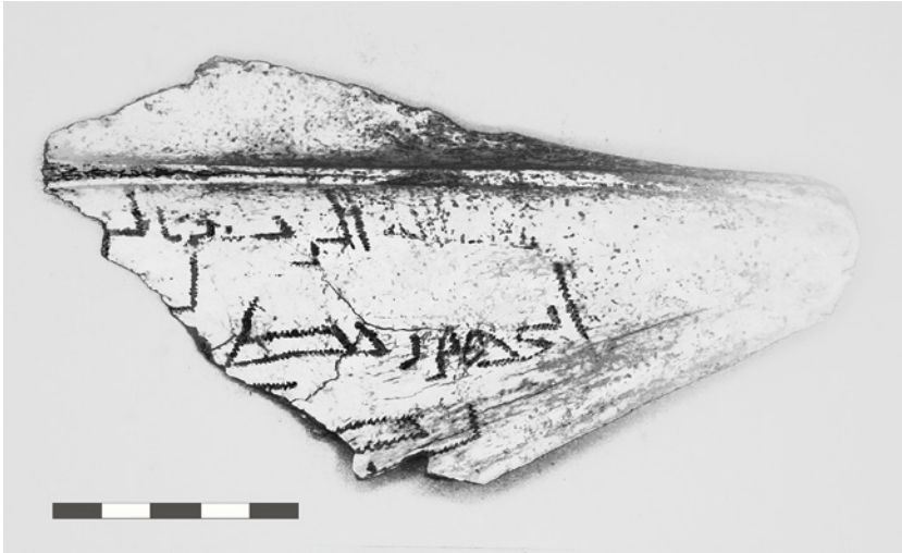
Fig. 8. Fragmento de escápula que conserva en una de sus caras el inicio de tres renglones de grafía árabe, aunque el tercero está muy deteriorado, casi imperceptible antes de su limpieza y consolidación