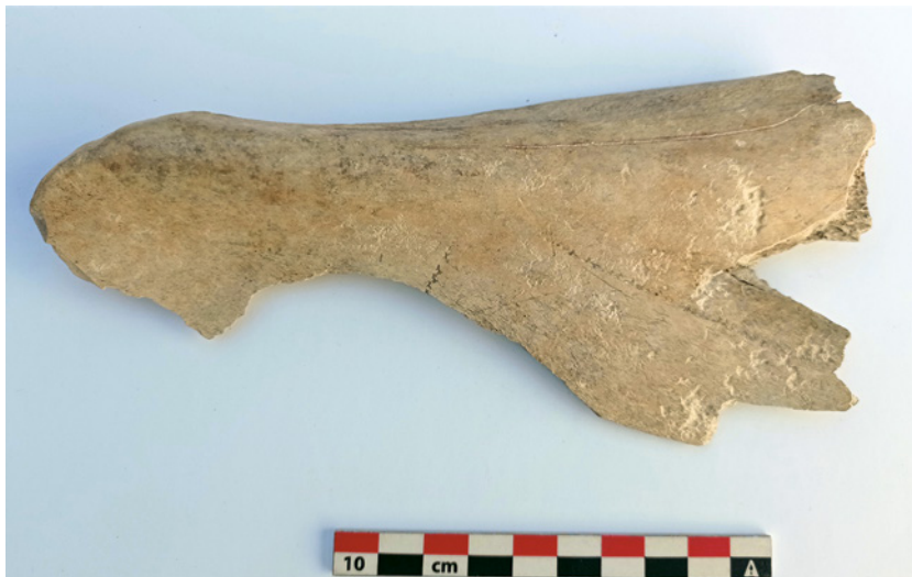
Fig 22. Fragmento de escápula de cervus, pulimentada y con dos líneas incisas formando un ángulo recto, realizadas posiblemente con un objeto metálico por presión. Silo 24. Sector 2. UE 2.179.