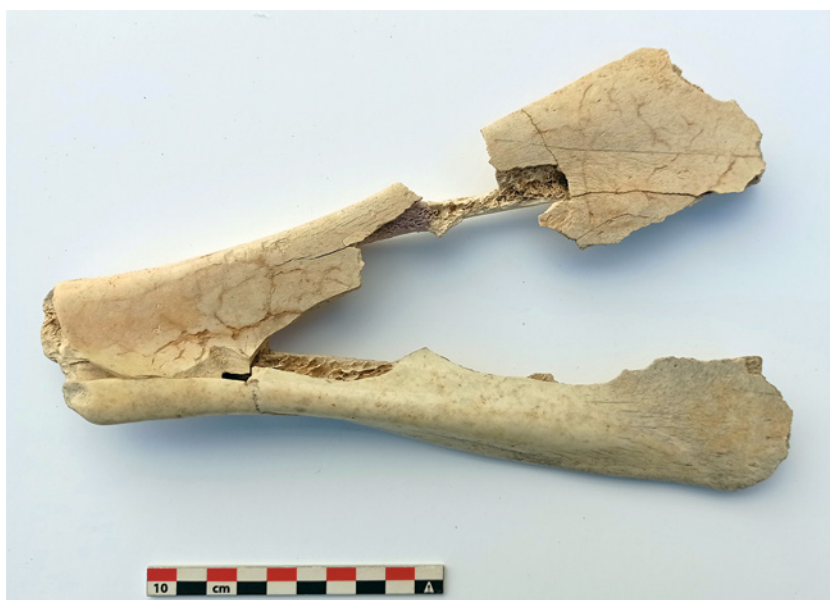
Fig. 14. En la parte superior de la cara opuesta se observa una línea incisa horizontal