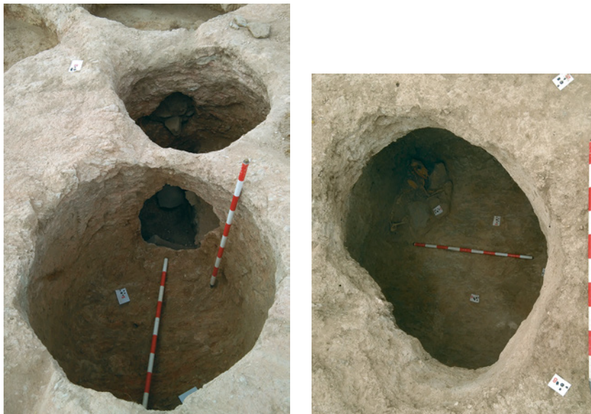
Fig. 3. Subestructuras tipo silo presentes en el yacimiento El Pantano I y II . Imagen derecha: con enterramiento de un perro.