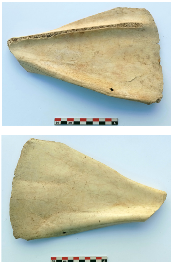
Fig. 19. Escápula silo 9. Escápula trabajada para realizar epígrafe. Se observa la retirada de la espina escapular y de la cavidad glenoidea. Se perfora la pieza, posiblemente para ser colgada.