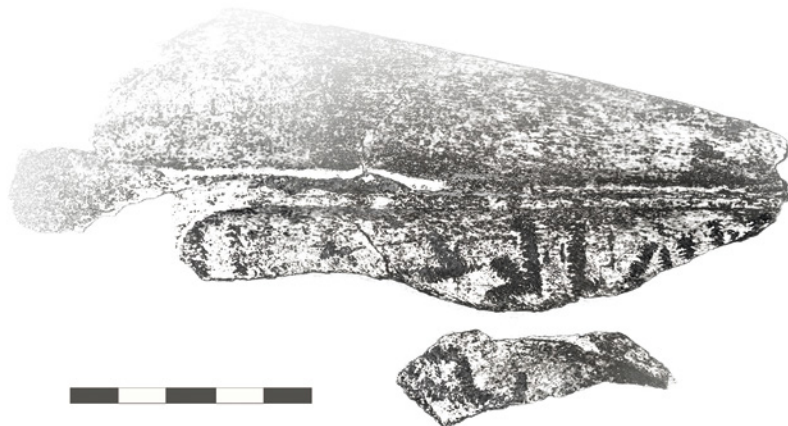
Fig. 10. Escápula Silo 29. Sector 2.

Dos fragmentos de escápula con restos de grafía en una de sus caras. Se ha conservado parcialmente la basmla completa en el primer renglón y en el pequeño fragmento suelto restos de la secuencia alfabética.