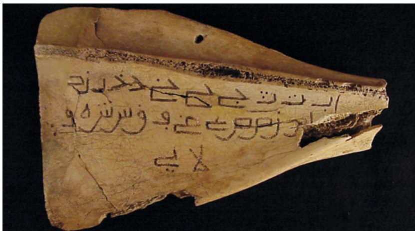
Fig. 24. Escápula de Bóvido del Castillo de Huete (Cuenca). Propiedad de la Real Academia de la Historia.

mencionadas como más próximas 15 . Así se observa en el ejemplar procedente del Castillo de Huete, en Cuenca, conservado en el Gabinete de Antigüedades de la Real Academia de la Historia 16 , que presenta anotación subsidiaria magrebí de puntos diacríticos, por el qāf con punto arriba y fā' con punto debajo. Lo mismo sucede en los ejemplares hallados en el casco antiguo de Alicante y en los de Huesca, Lérida o Valencia 17 , así como en el procedente de un silo de Priego (Córdoba) 18 .