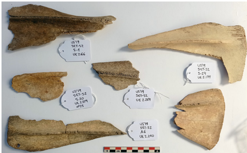
Fig. 21. Conjunto de fragmentos de escápula con preparación para su uso como tablilla epigráfica