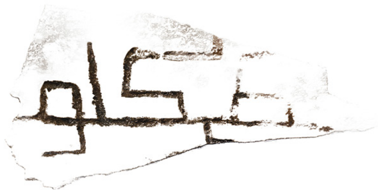
Fig. 17. Escápula silo 12. Fragmento 2.

Conserva parte de la secuencia consonántica en dos renglones.