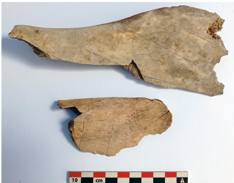
Fig. 22. Vista de las líneas incisas en las escápulas S30 Sector 2 UE 2.219 y S1 Sector 2 UE 2.66