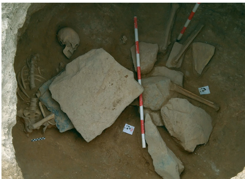
Fig. 5. Yacimiento El Pantano I , silo 9. Inhumación de época califal. A la derecha, localización de una escápula preparada para ser epigrafiada.

En lo que respecta a la presencia de inhumaciones, se han detectado dos tipos de enterramientos en el yacimiento El Pantano I y II : el primero, de carácter más excepcional, consiste en 2 enterramientos en silo. El segundo es un pequeño espacio funerario generado tras la amortización de los silos a fines del s. X - inicios del siglo XI, con 2 adultos, 1 juvenil y 2 infantiles situado en la zona centro-este del sector 2, al que se suma otra inhumación infantil en el sector 3. Las tumbas, sin ajuar, —a excepción de un jarrito/a fragmentado en la tumba infantil del sector 3—, se localizan inmediatamente por debajo del estrato vegetal, con fosas excavadas tanto en la roca natural como en los rellenos de amortización de un conjunto de silos. Su adscripción crono-cultural se propone principalmente a partir de los rellenos en los que fueron excavadas las fosas (con materiales del s. X - inicios del XI) y de la orientación de los cuerpos. Tumbas de fosas estrechas, en sentido suroeste-noreste, cuerpos en decúbito lateral derecho, con la cara dirigida al este-sureste, nos indican que nos hallamos ante una comunidad islamizada.