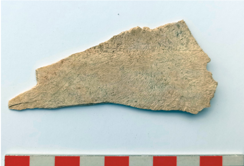
Fig. 18. Escápula silo 12. En la cara externa, resulta visible una línea incisa horizontal y, en paralelo, el fragmento de otra.