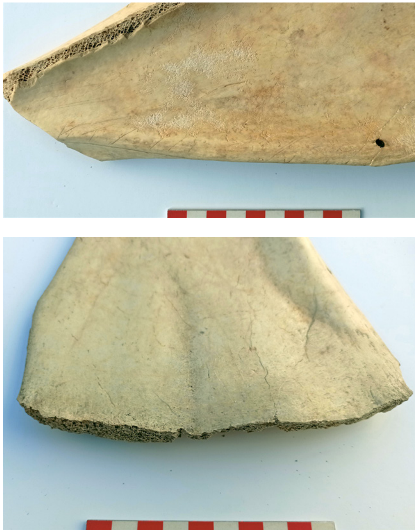
Fig. 20. Detalles. En la imagen superior se puede ver que en la cara interna o escapular se han realizado una serie de trazos incisos paralelos de funcionalidad indeterminada. En la imagen inferior, vemos la eliminación de la zona más fina y frágil de la escápula.