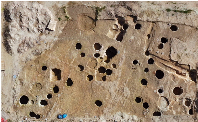
Fig. 2. Vista aérea parcial de las subestructuras excavadas

El elemento documentado con mayor profusión son subestructuras tipo hoyo o silo excavados directamente en el terreno, cuya cronología situamos en el siglo X y en el primer tercio del XI, en atención principalmente a los materiales cerámicos recuperados en sus rellenos de amortización, cronología refrendada por las dataciones radiocarbónicas realizadas sobre los contextos funerarios del asentamiento 1 . No se conserva ningún resto de estructuras por encima de la rasante de roca natural, ya que la roturación del terreno ha eliminado cualquier elemento que pudiera estar sobre dicho estrato. Se han documentado más de 80 subestructuras tipo hoyo, en su mayoría con la base plana, cuyos diámetros varían entre los 0,60 m y los 2 m, y con profundidades que van desde los 0,55 m hasta los 2 m. Se conservan otras subestructuras asociadas, como cubetas y posibles fondos de cabaña o estructuras semihundidas, cuyos rellenos de amortización contienen materiales encuadrables también en contextos de los siglos X y XI.