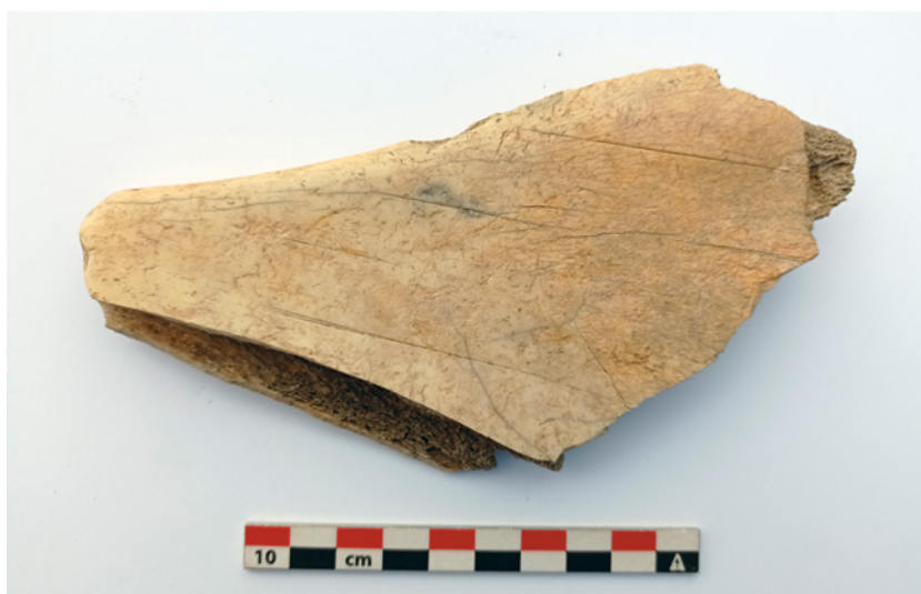
Fig. 9. En la cara externa, conserva 4 líneas horizontales incisas, dispuestas en paralelo a 1,5 y 2 cm de distancia