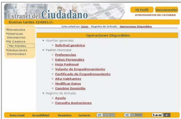
Página web: Extranet del Ciudadano