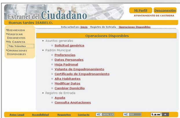
Página web: Extranet del Ciudadano