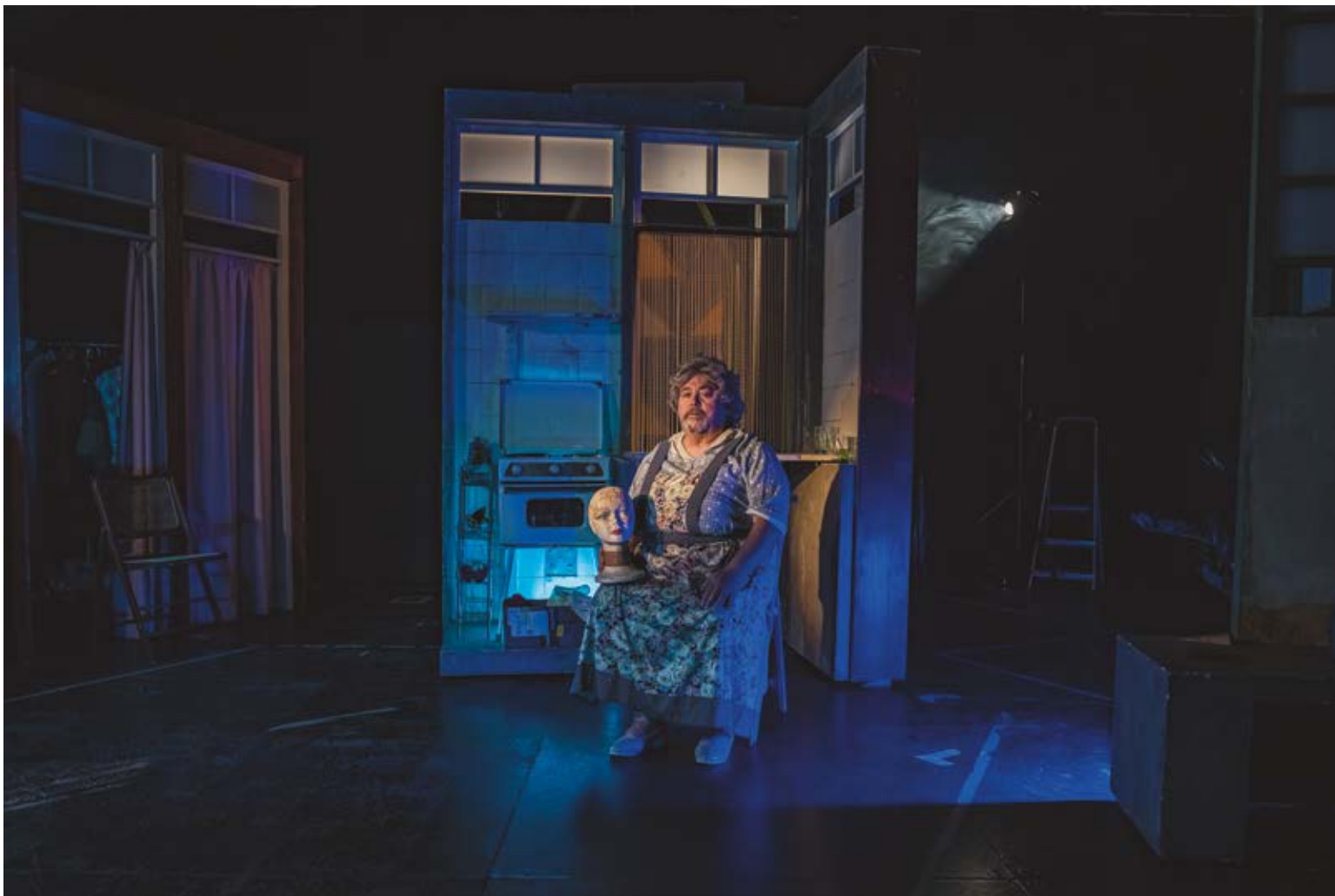
HOMENAJE. Dibond 90 x 60 cm