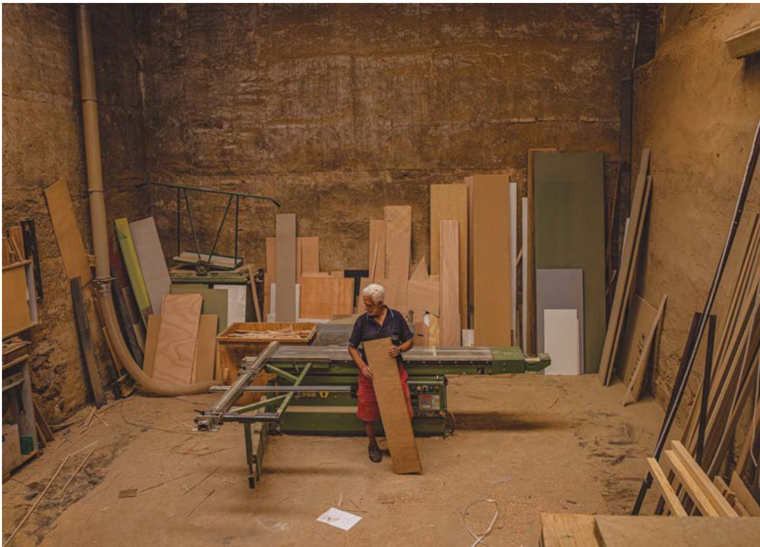
ASCENDENTE. Dibond 85 x 60 cm