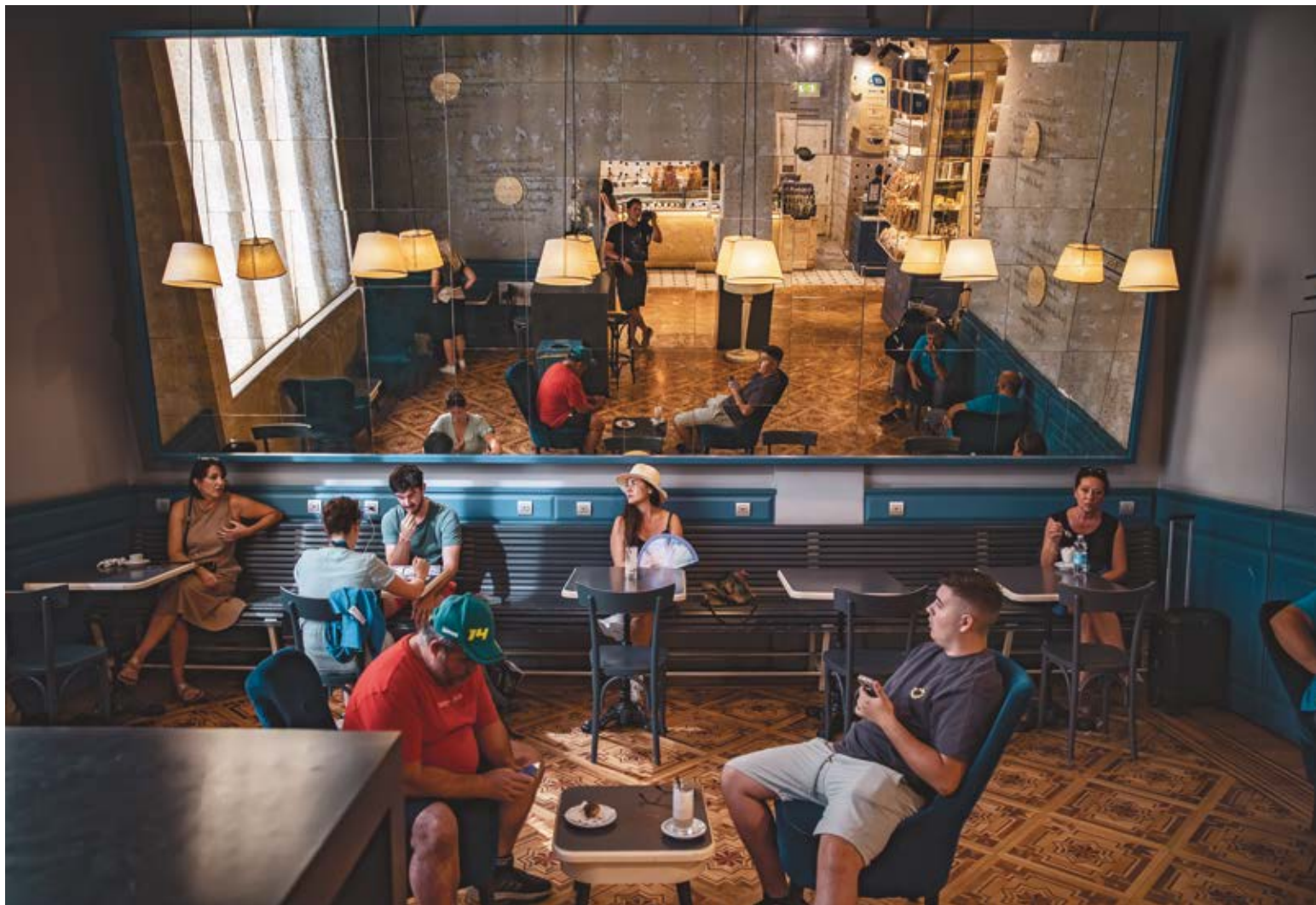
AUTORRETRATO. Dibond 90 x 60 cm