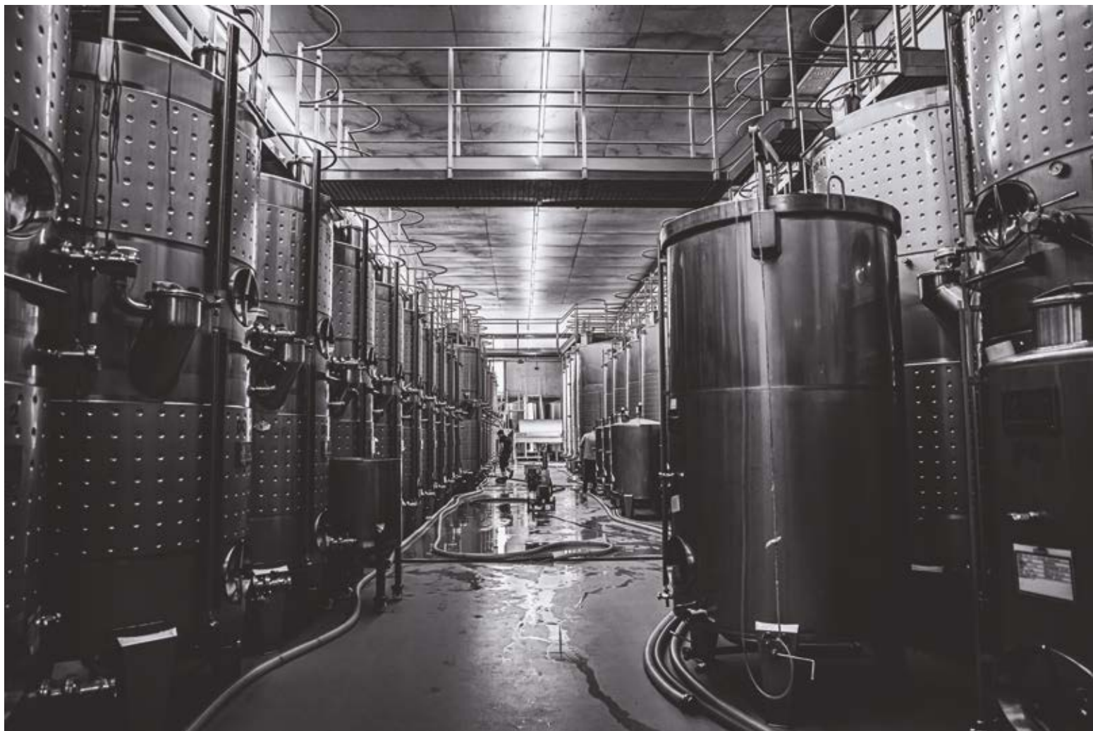
CANÁ. Dibond 90 x 60 cm