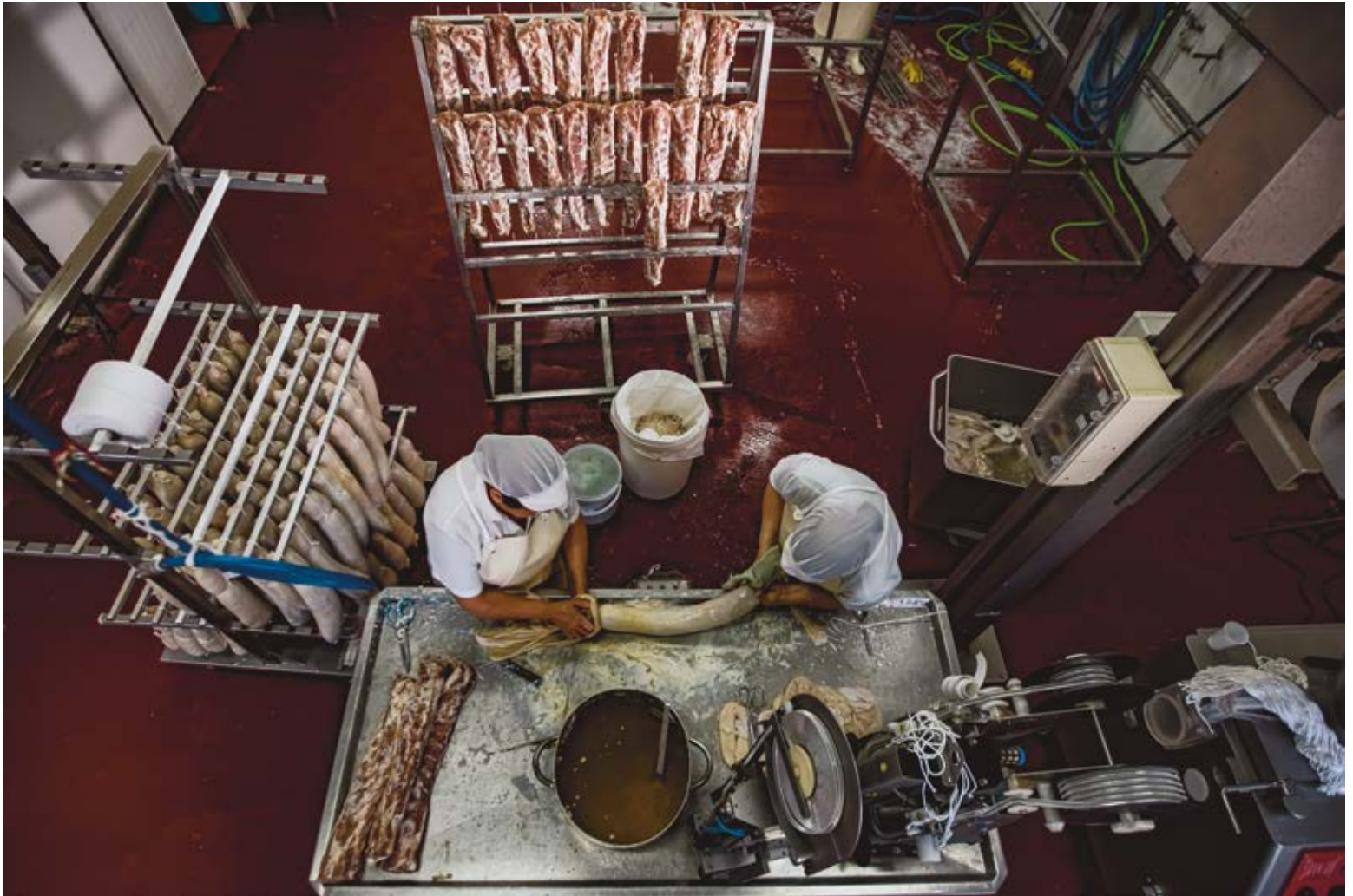
DOBLANDO EL LOMO. Dibond 90 x 60 cm