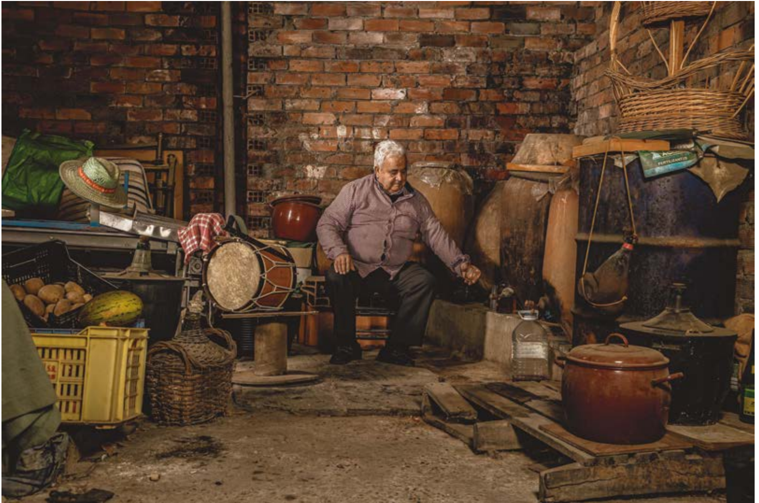
EL DESCANSO DEL OBRERO. Dibond 90 x 60 cm