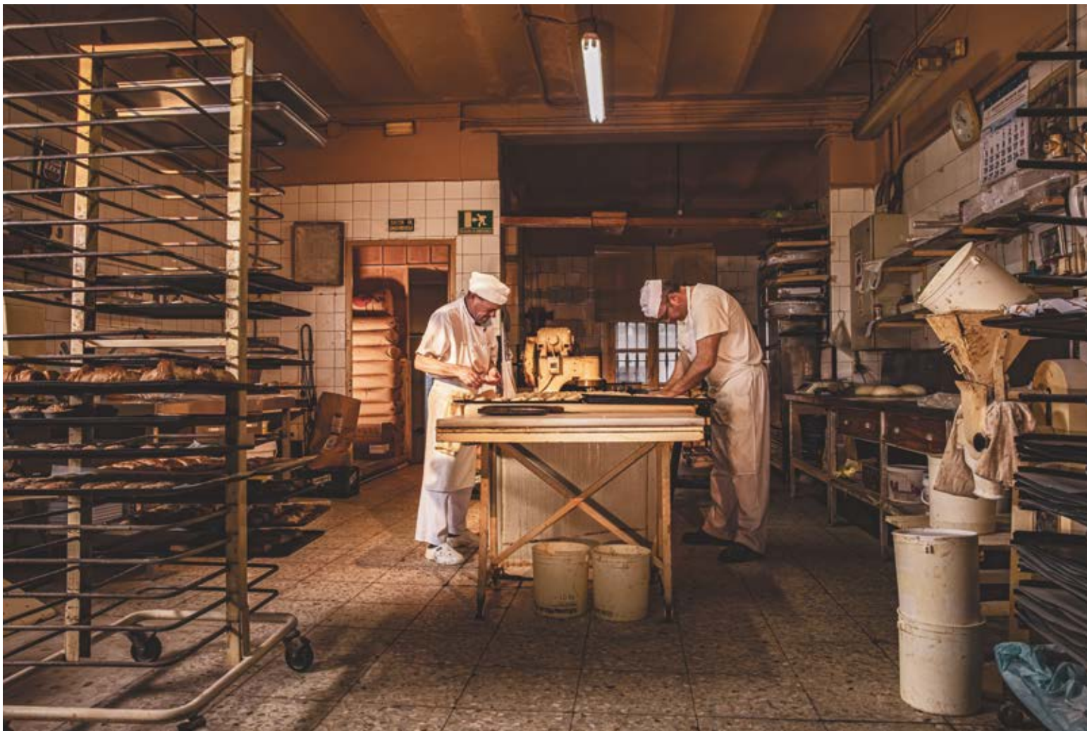
DEMIURGOS. Dibond 90 x 60 cm