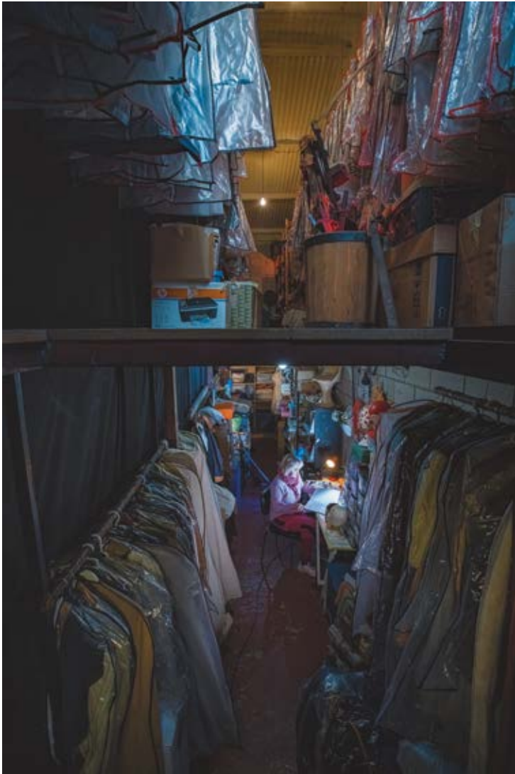
SEGUNDA PIEL. Dibond 90 x 60 cm