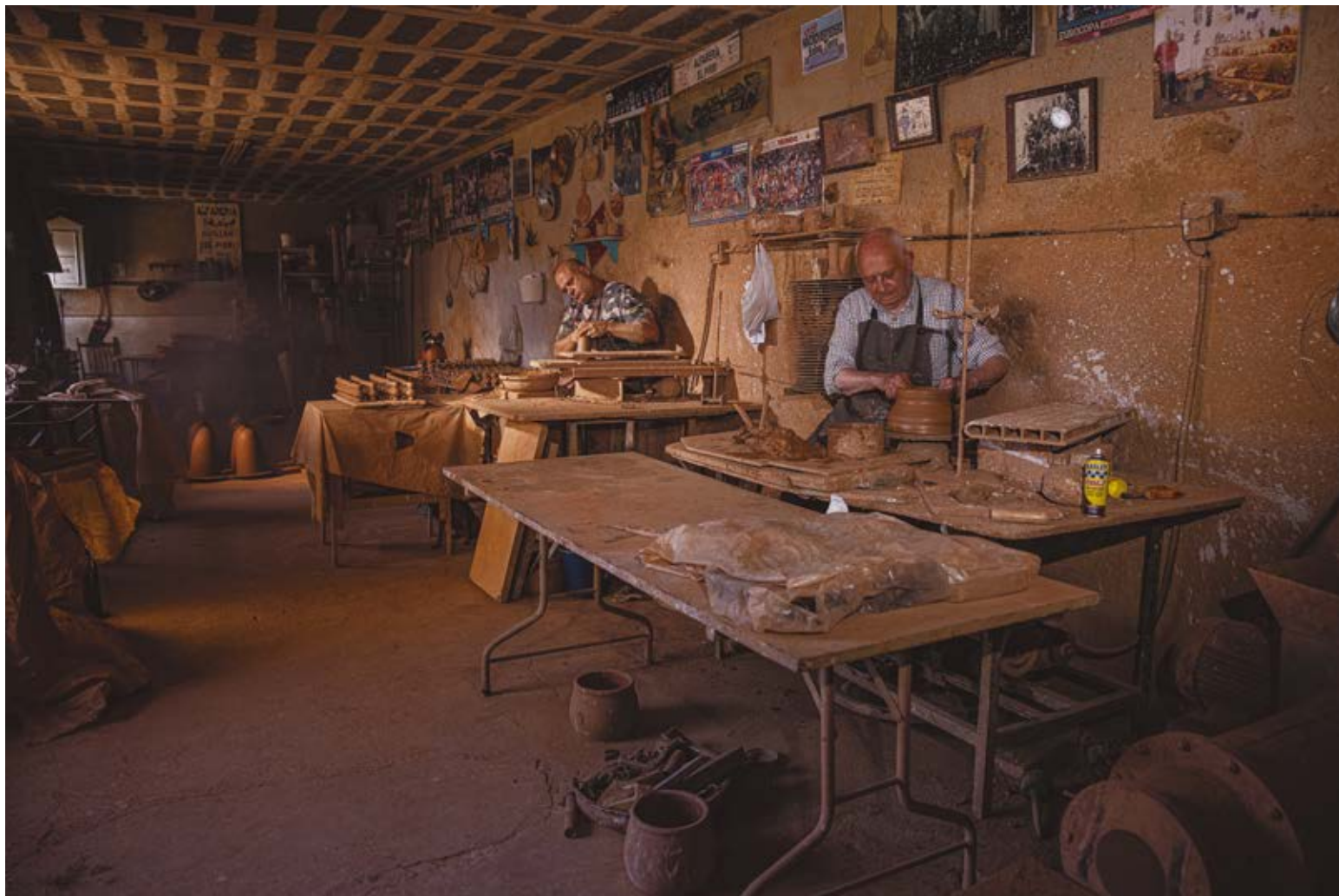
LEGADO. Dibond 90 x 60 cm