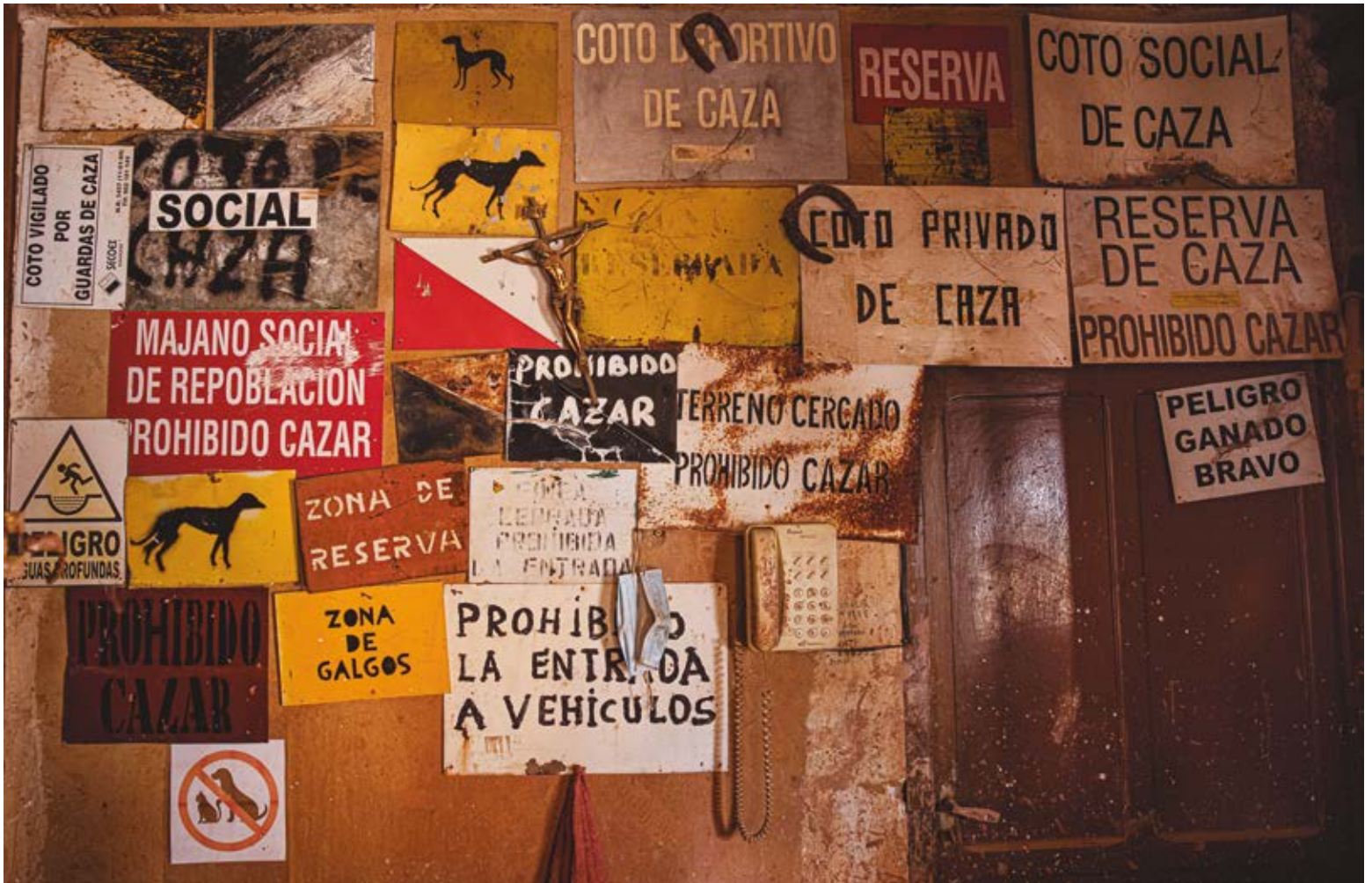
EL PASEO. Dibond 90 x 60 cm