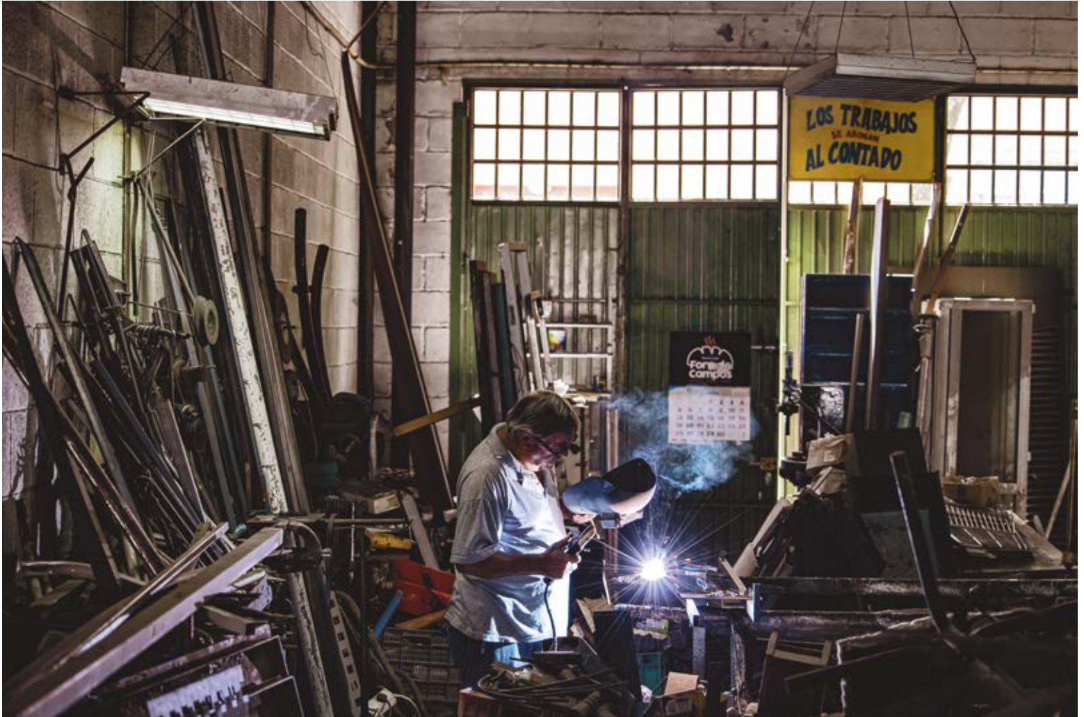
AL CONTADO. Dibond 90 x 60 cm