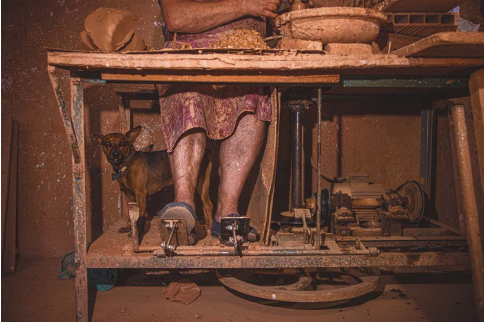
MIGA. Dibond 90 x 60 cm