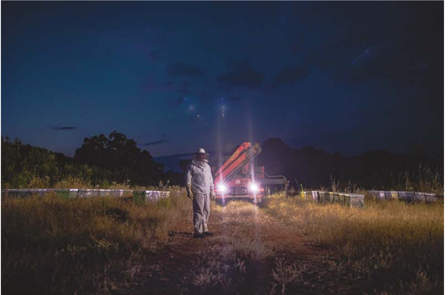
TRASHUMANCIA. Dibond 90 x 60 cm