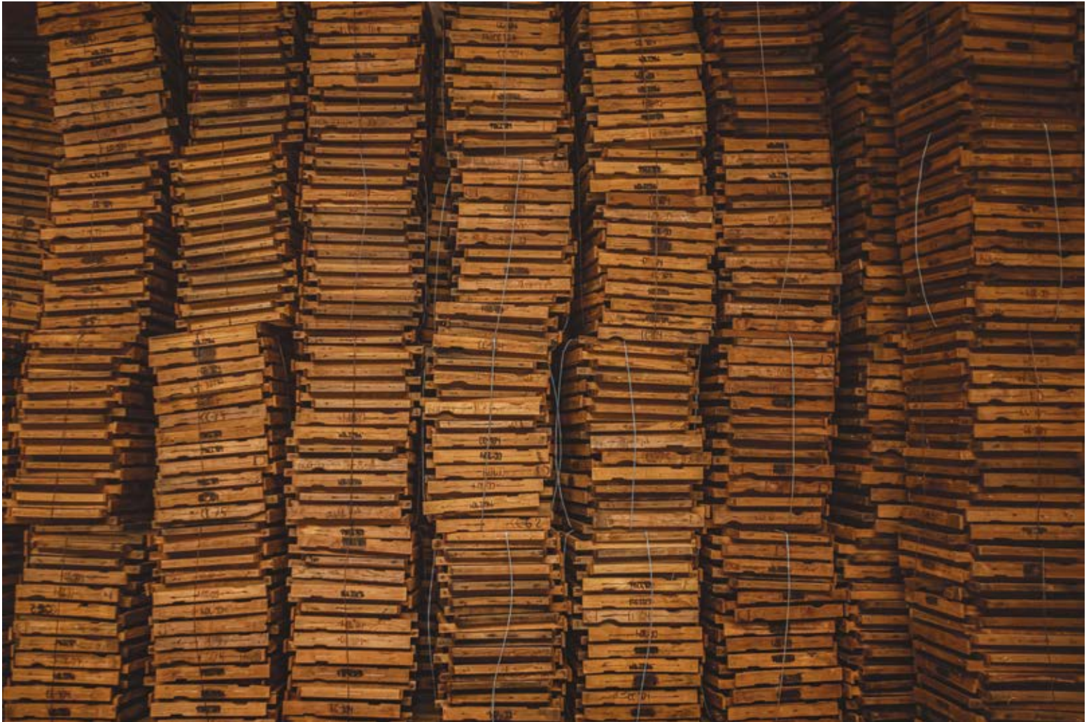
LOS CUADROS. Dibond 90 x 60 cm