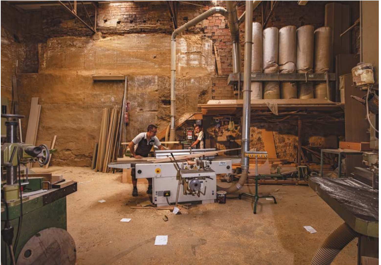
PERFILES. Dibond 86 x 60 cm