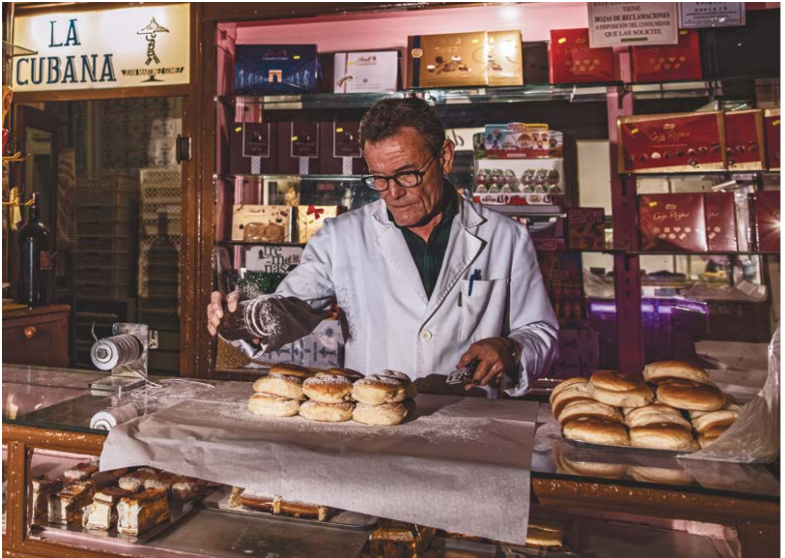
TOQUE DE GRACIA. Dibond 84 x 60 cm