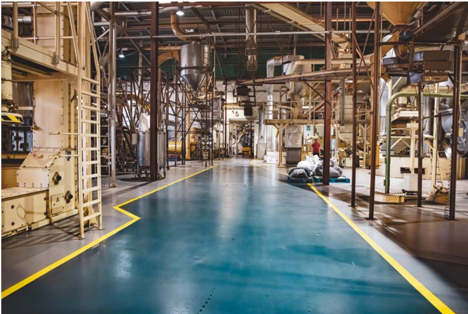
CAMINO DE OZ. Dibond 90 x 60 cm