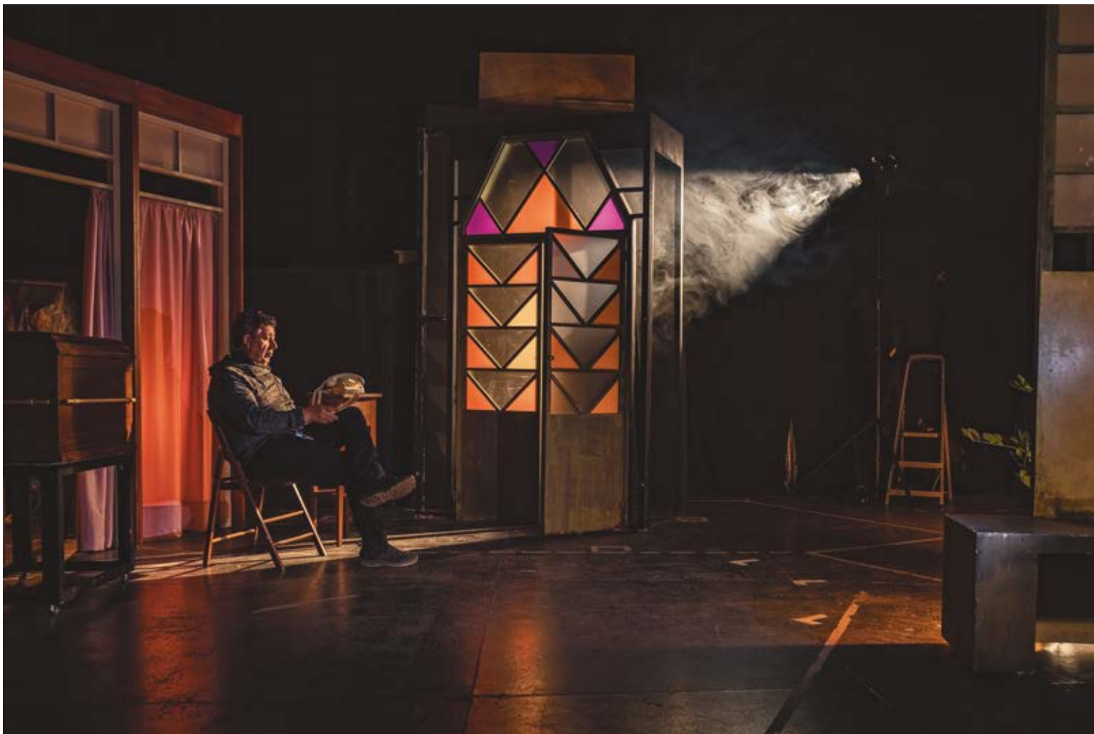
EL ÚLTIMO GUIÓN. Dibond 90 x 60 cm