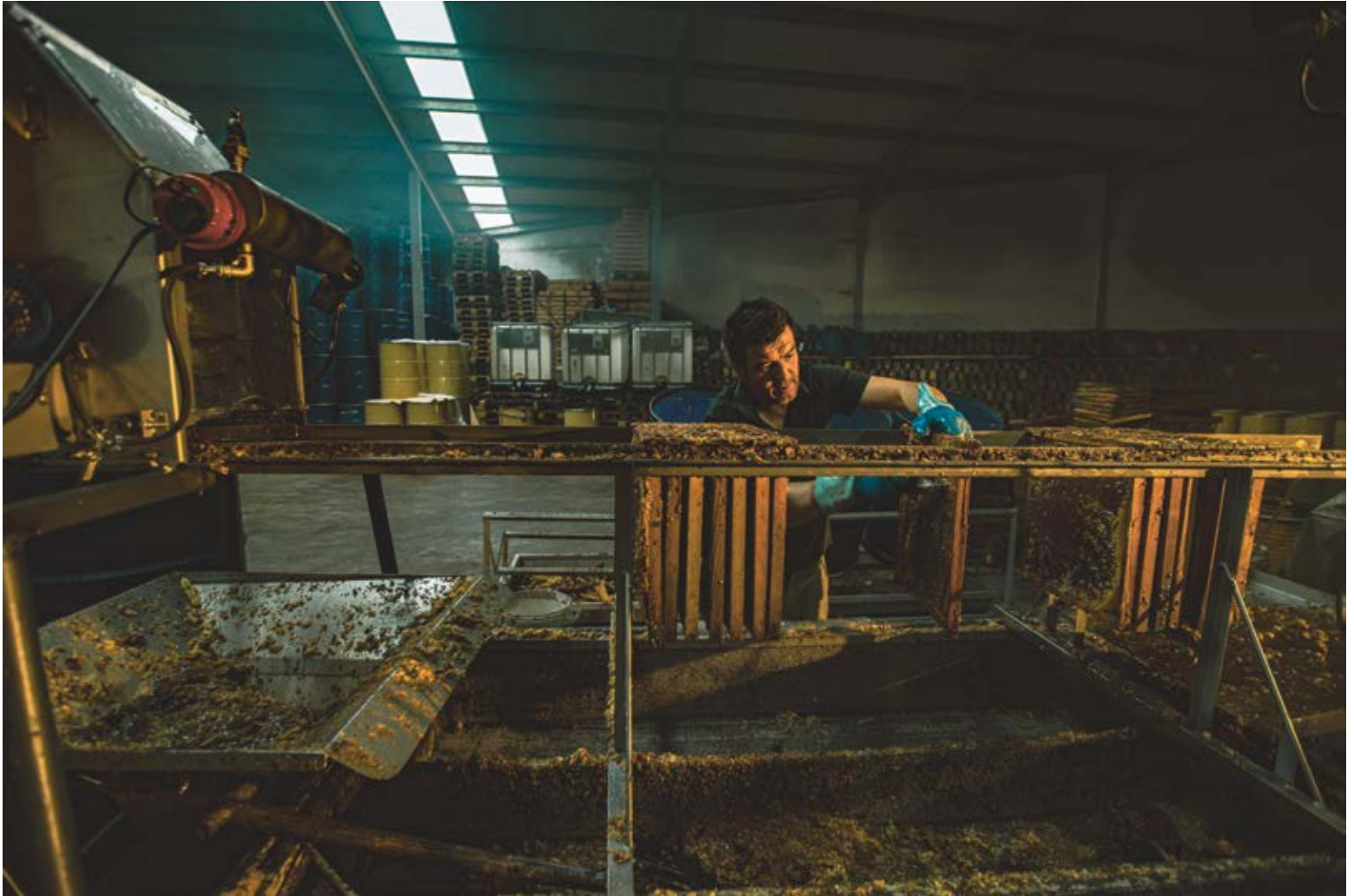
EL DORADO. Dibond 90 x 60 cm