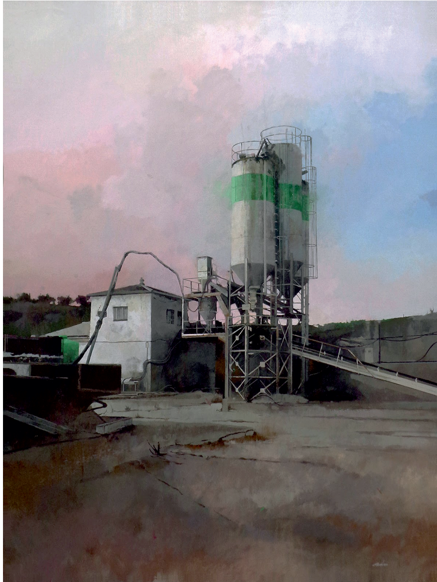
Francisco Escalera González Paisaje Industrial, P.r 79 Mixta (acrílico-óleo) Sobre Lienzo Córdoba