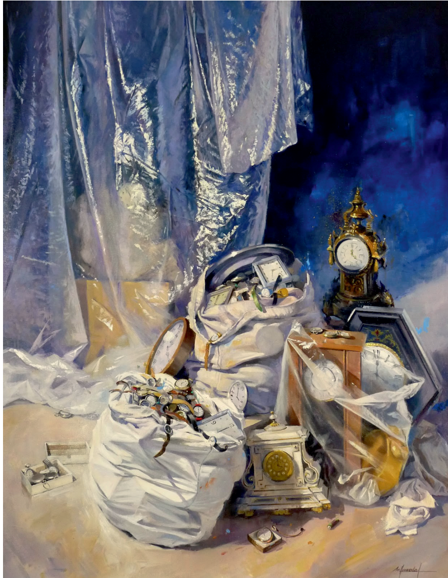
Mercedes Humedas Parés Cuando el tiempo se detuvo Óleo Sobre Tela Lleida