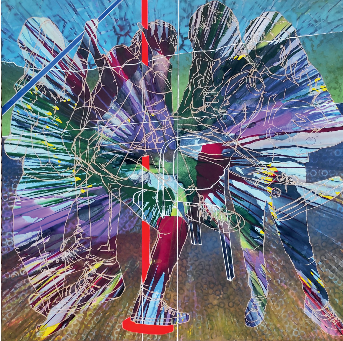
Javier Soria Ortega Composición variable para un resultado único Mixta Con Incisiones A Butil Sobre Tabla Valencia