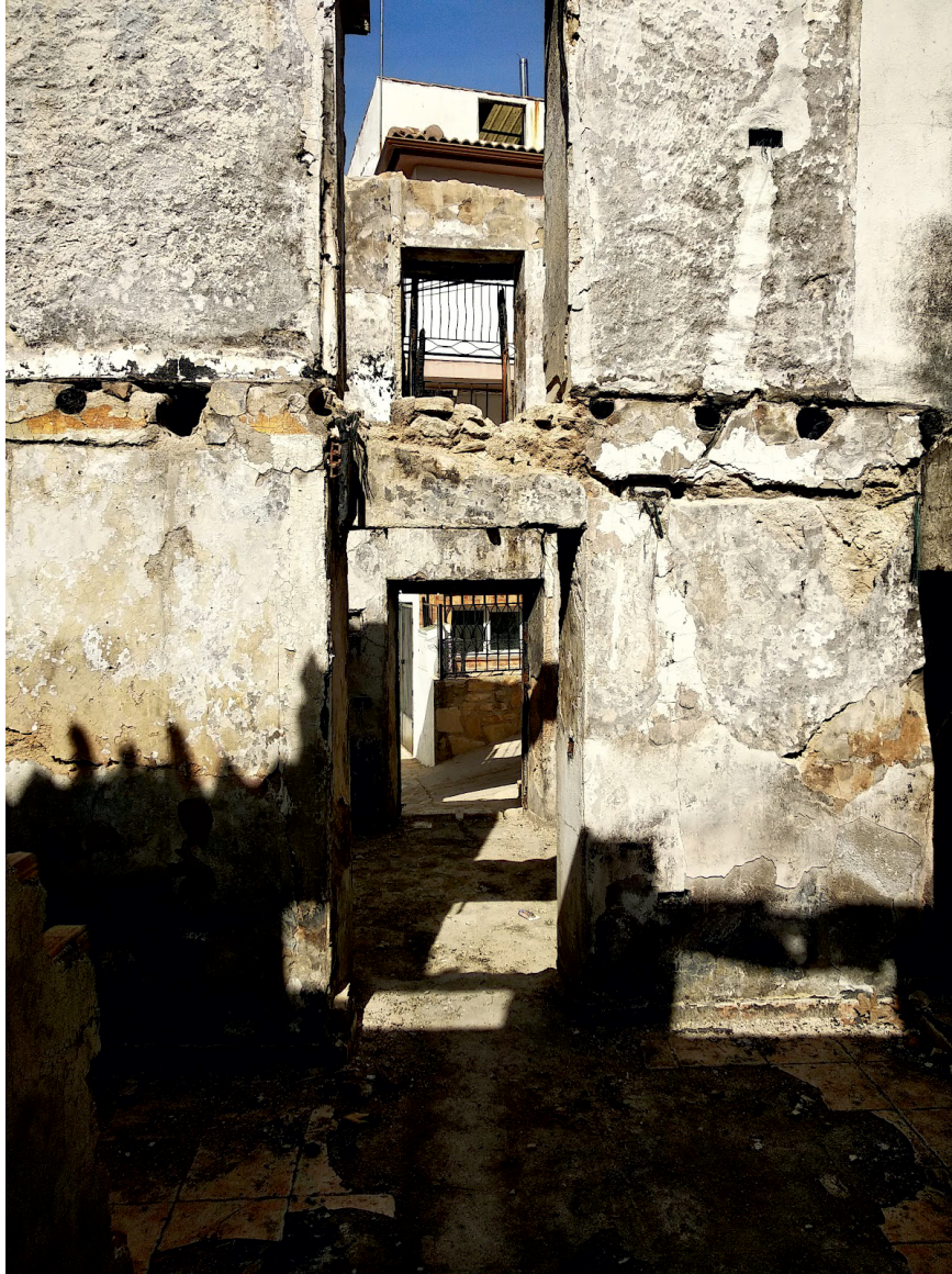
José Luis Guerrero Fernández Image the fire Técnica Mixta Sobre Bastidor Pegado A Tabla Jaén