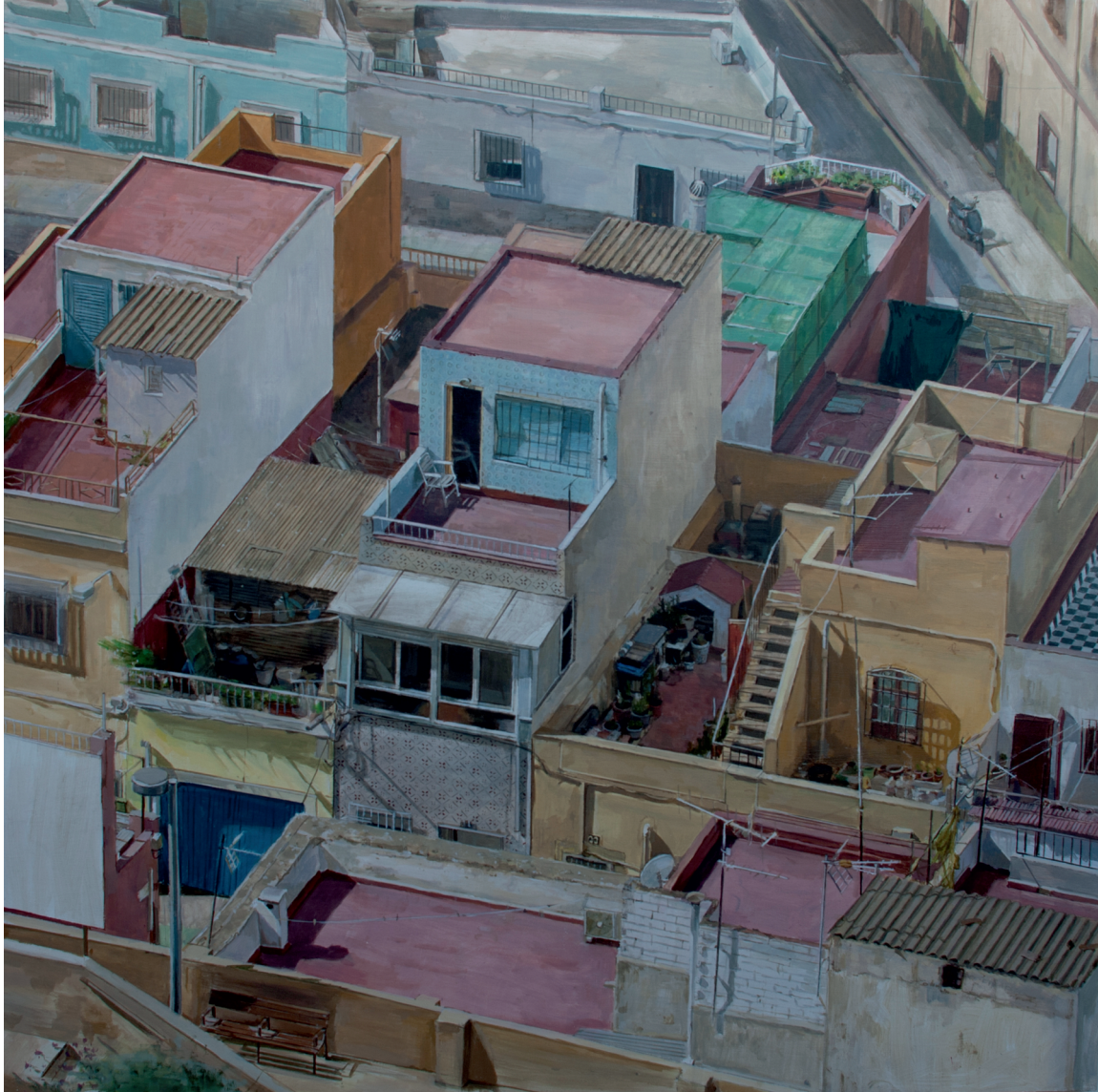
David Martínez Calderón La cuadrícula IV Óleo Sobre Tabla Huércal de Almería (Almería)