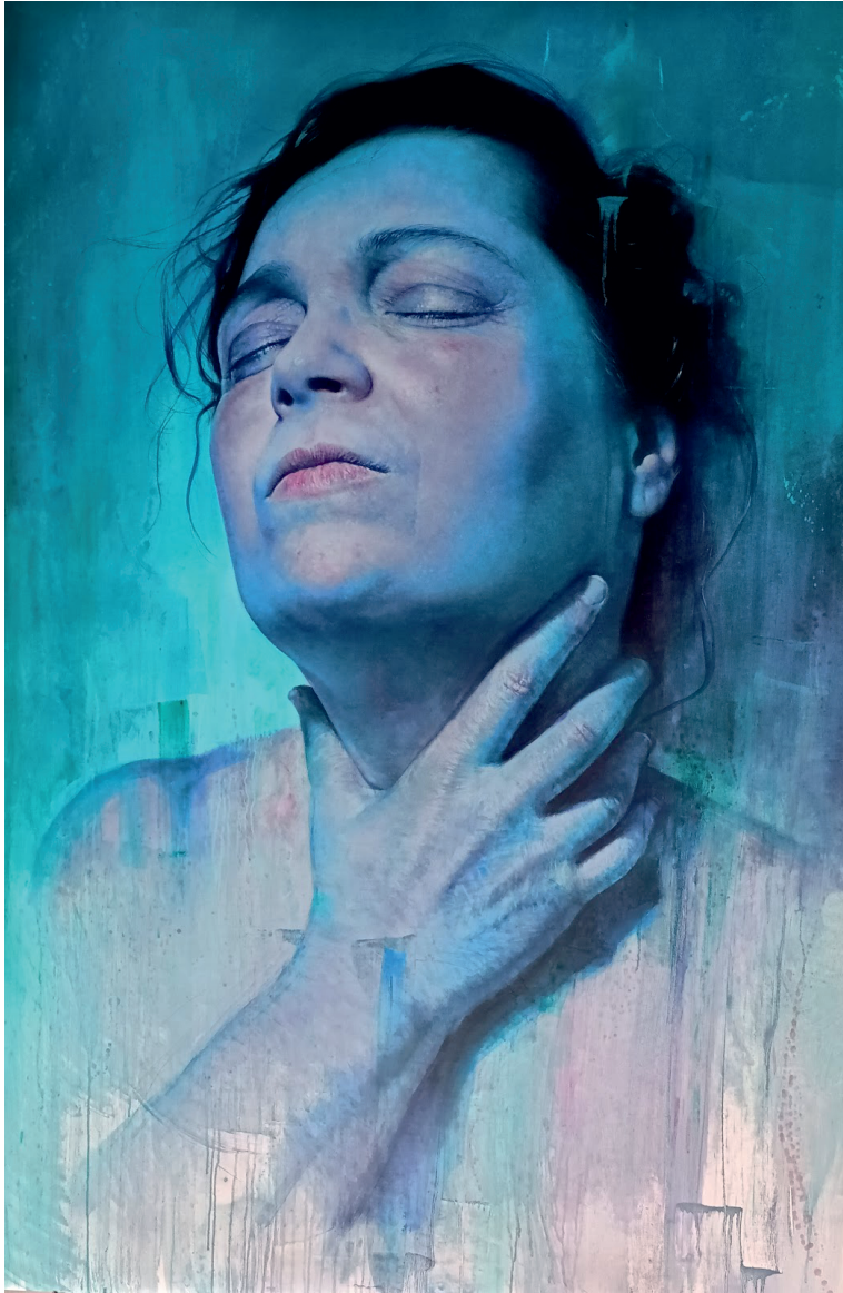
Rafael Cervantes Gallardo La angustia Mixta Sobre Tabla Córdoba