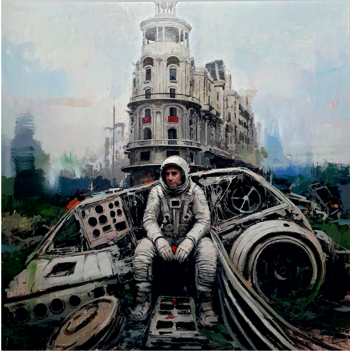
Manuel Castellero Ramírez Ozymandias Mixta Sobre Tabla Córdoba