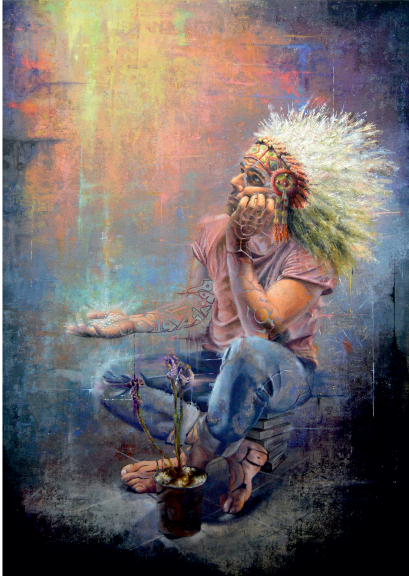
Davide Lionetti La danza della pioggia Óleo Sobre Lienzo Madrid