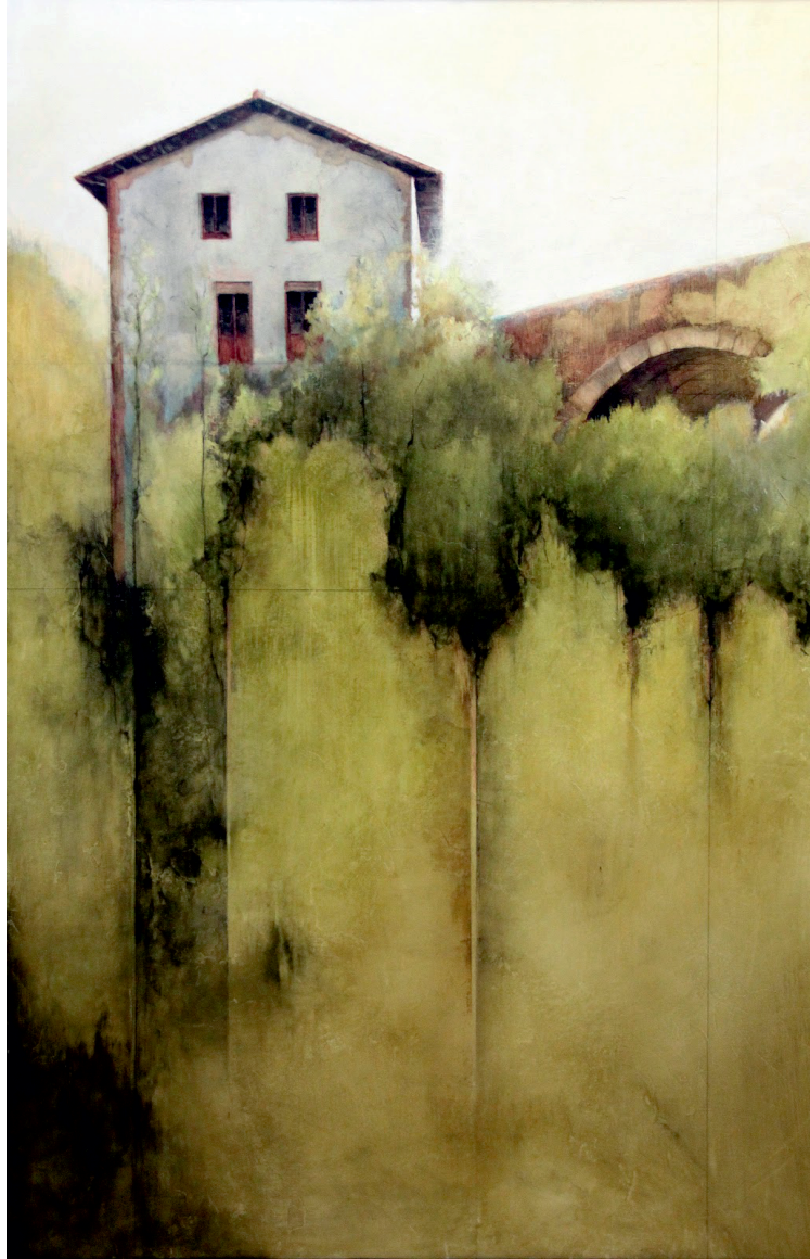
Cristina Díaz García La casa del puente Acrílico Y Óleo Sobre Madera Sevilla