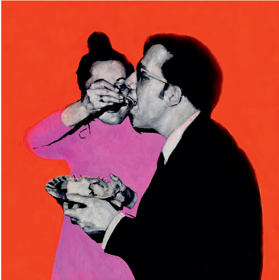
Wenceslao Robles Escudero Criando Óleo Y Spray Sobre Lienzo Jérez de la Frontera (Cádiz)