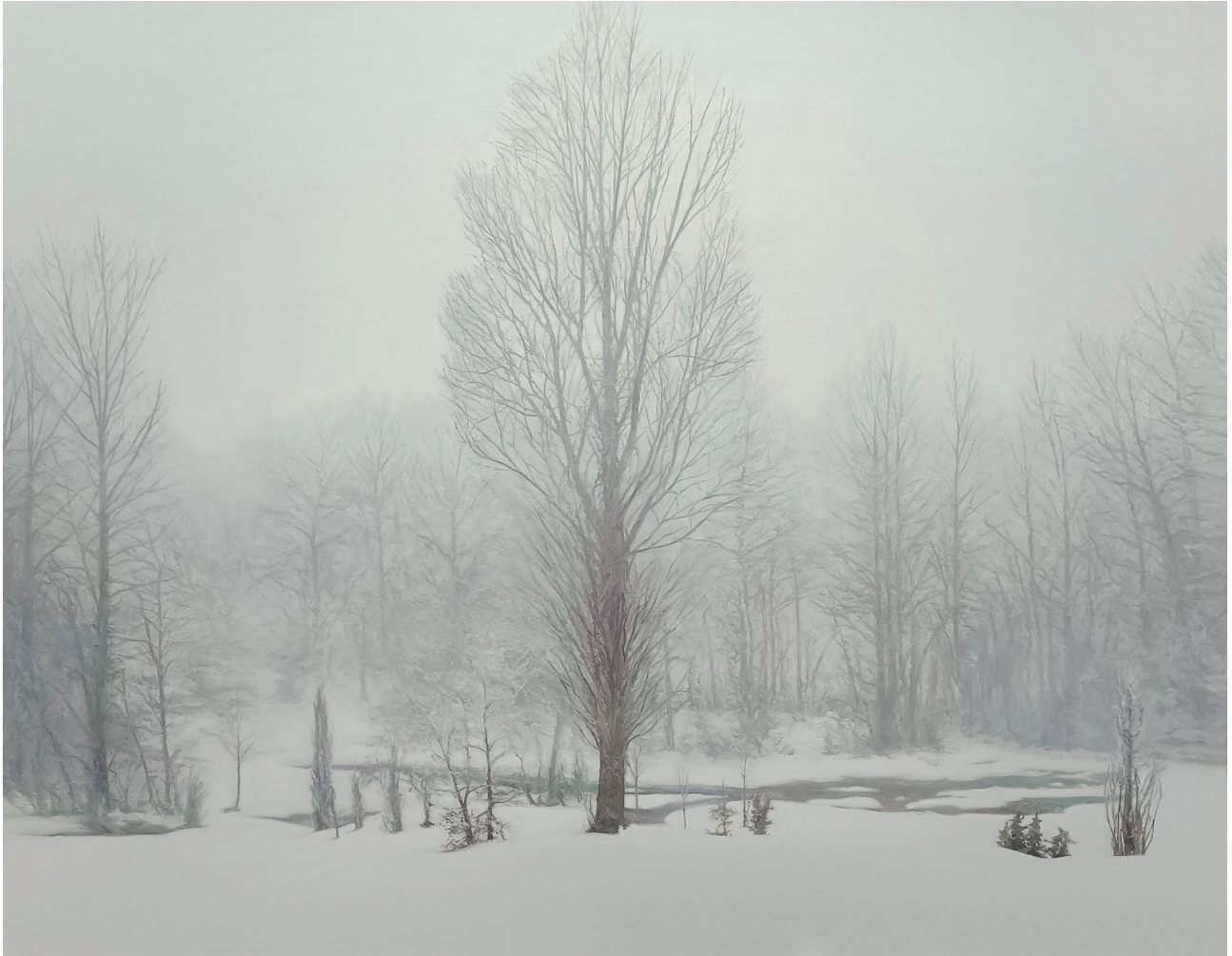
Guillermo Sedano Vivanco Un intenso invierno Óleo Sobre Lienzo Medina de Pomar (Burgos)