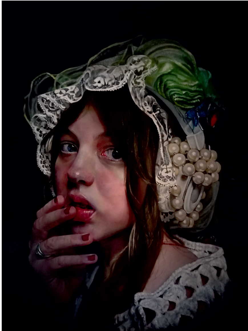
Juan Carlos Macías Toro La Mirada contigo Óleo Sobre Lino Sevilla