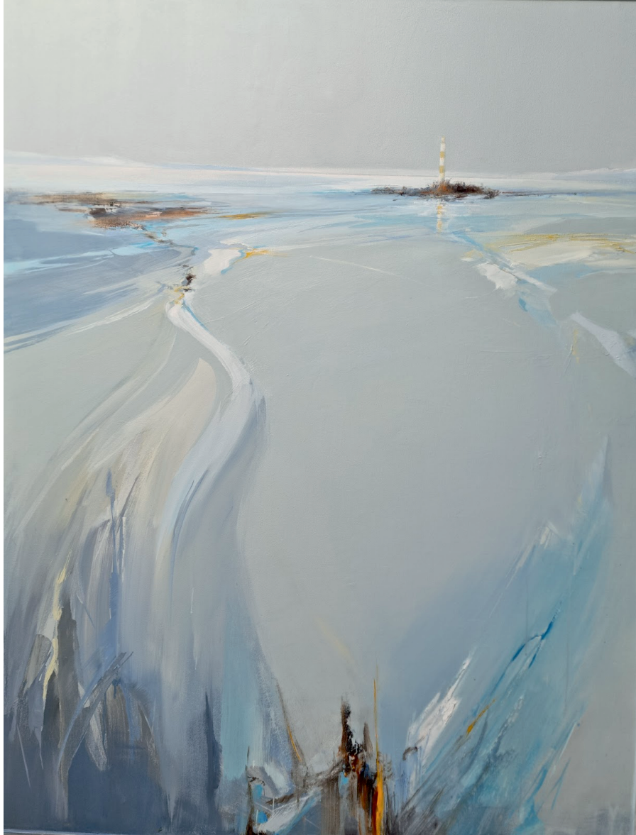
Faro fin del mundo Acrílico Sobre Cartón Pluma Massamagrell (Valencia)