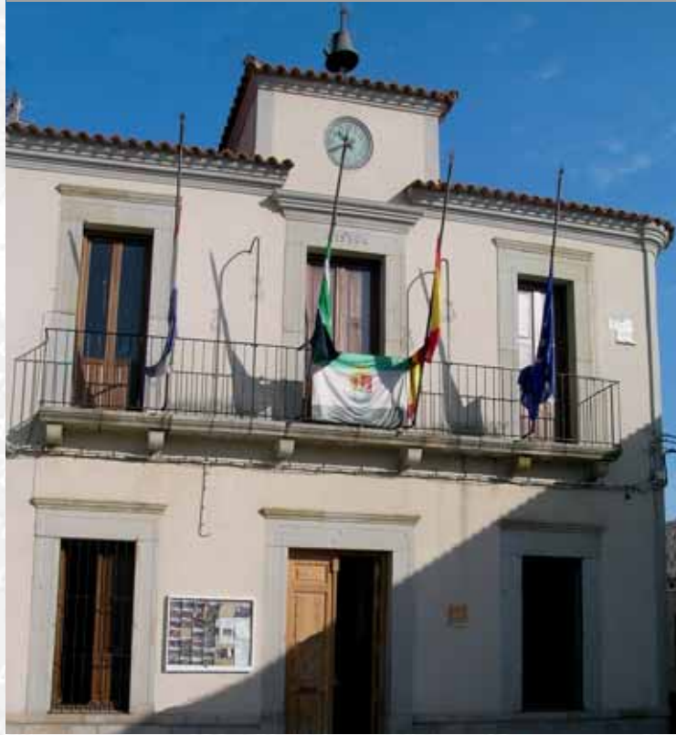
Fachada del Ayuntamiento.