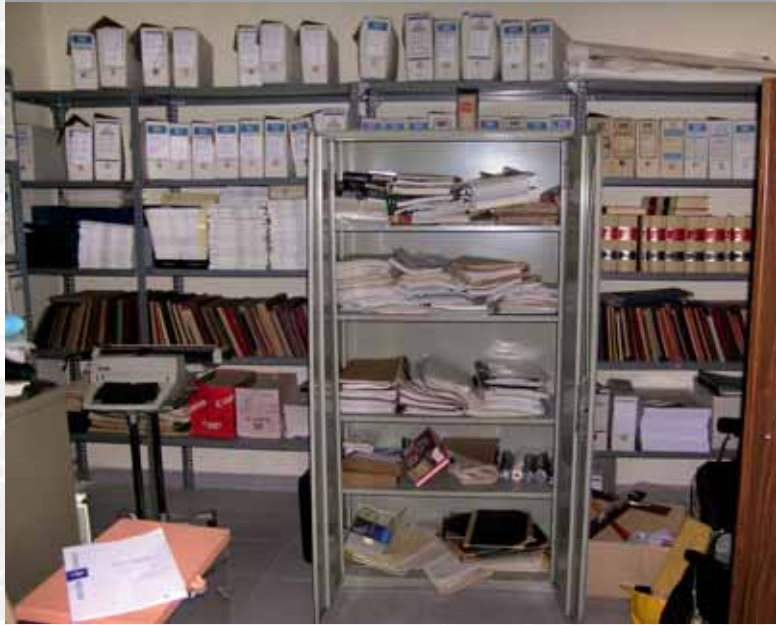
Archivo Municipal de Mengabril antes de elaborar el Inventario.