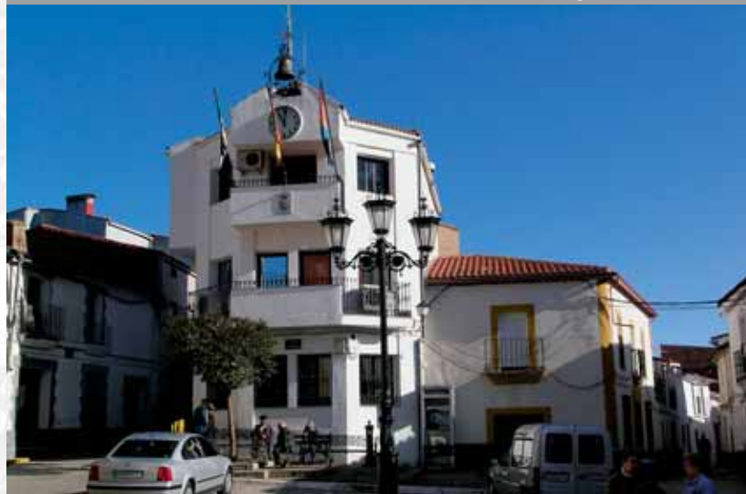
Fachada del Ayuntamiento.