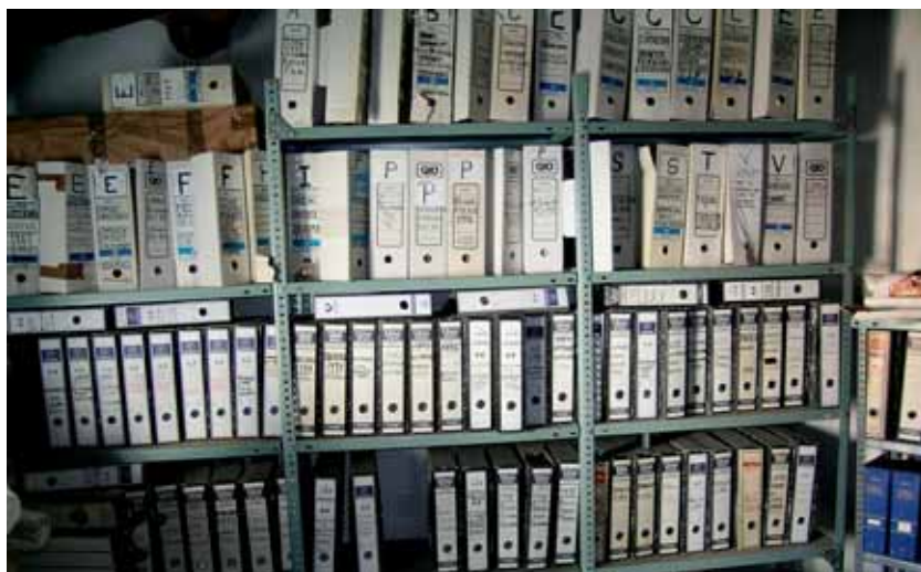
Archivo Municipal de Villarta de los Montes antes de elaborar el Inventario.