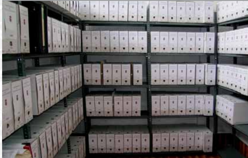
Archivo Municipal de Villarta de los Montes después de la elaboración del Inventario.